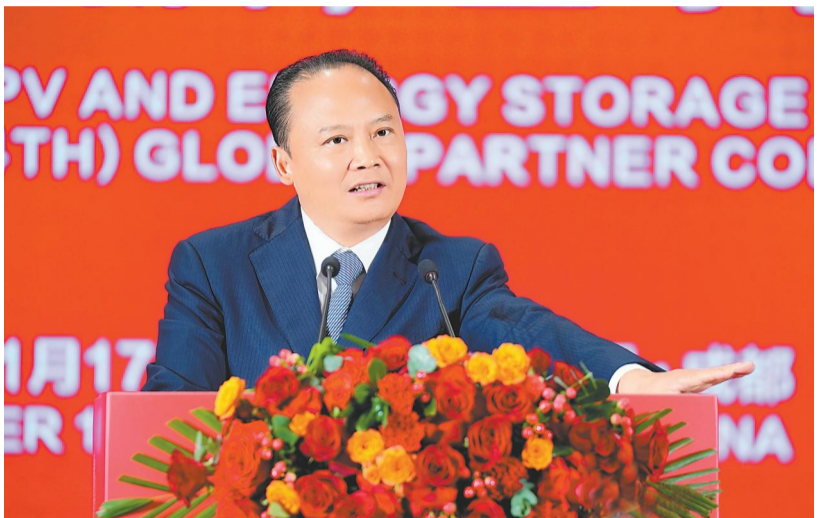
全国人大代表、全国工商联副主席、全联新能源商会执行会长、通威集团董事长刘汉元主席出席大会并致辞

2024 第七届中国国际光伏与储能产业大会暨通威太阳能(第四届)全球合作伙伴大会隆重举行