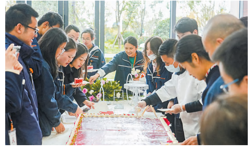
员工共享生日蛋糕

“十一年来,我们与公司共同成长,见证它从行业新星到如今的璀璨夺目。通威太阳能不仅照亮了绿色能源的未来之路,也照亮了我们每一位员工的初心梦想。愿公司在未来的日子里,继续引领行业前行,创新不止,光芒万丈!生日快乐,通威太阳能!新的征途,我们将与公司携手并进,共创更加辉煌的明天!”