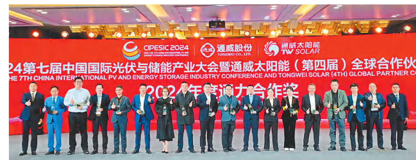
通力合作颁奖现场