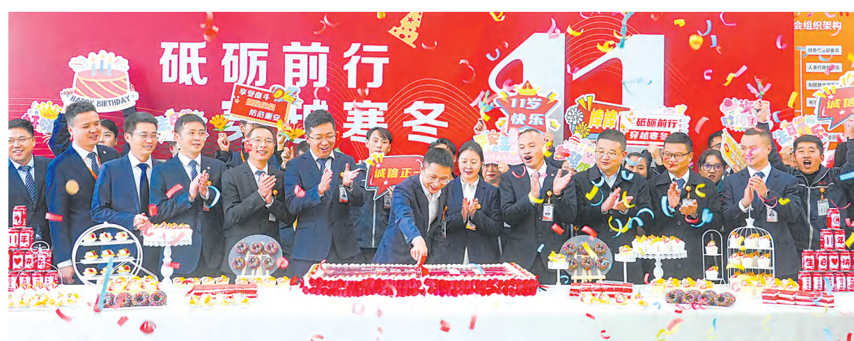
彭山公司管理团队与员工代表共享成长喜悦