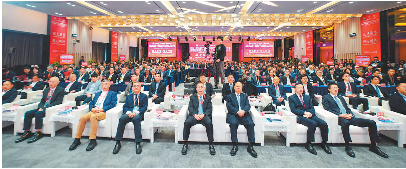
大会现场嘉宾云集