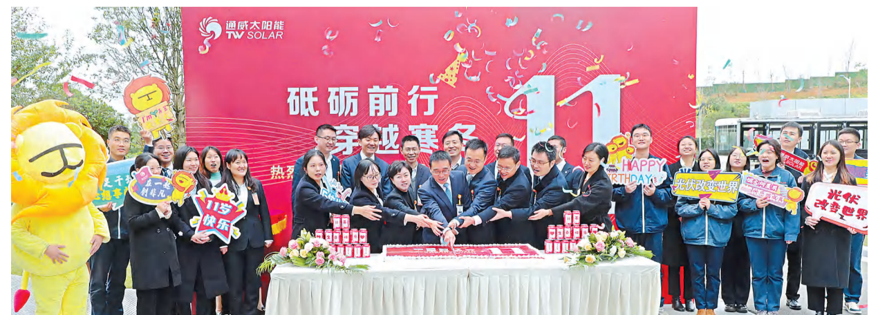
成都公司管理团队与员工代表共享成长喜悦

从0到4018天,通威太阳能始终秉持“通威,为了生活更美好”的愿景使命,深耕绿色能源领域,脚踏实地,躬身前行;从87人到近20000人,通威太阳能全体追光者用少年般赤忱热烈的爱,坚守着“光伏改变世界”的初心,用11年时间谱写着关于“光”的赞歌。