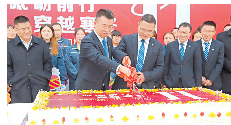
金堂公司管理团队与员工代表共享成长喜悦