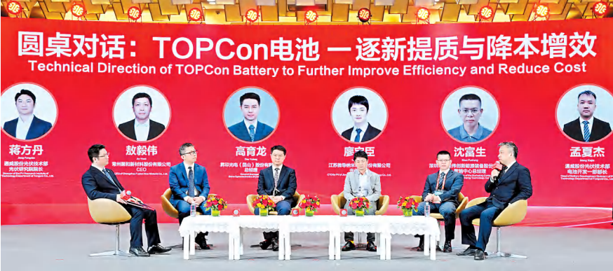
圆桌对话,智慧碰撞

便秉持与供应商、客户合作共赢的核心理念,不仅在业务上紧密协作,更在技术交流与文化建设中深度融合、相互借鉴。凭借共同的理念、一致的目标,通威太阳能与广大合作伙伴彼此成就、相互支撑,共同推动了行业的高质量发展。为表彰一路上携手同行的合作伙伴,大会特别颁发了砥砺前行奖、通力合作奖及同舟共济奖。