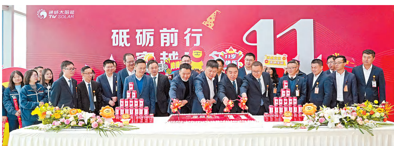
成都公司五期项目管理团队与员工代表共享成长喜悦