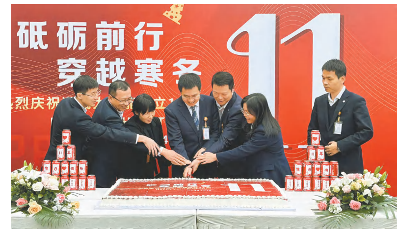
中威公司管理团队与员工代表共享成长喜悦