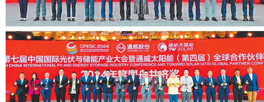
同舟共济颁奖现场