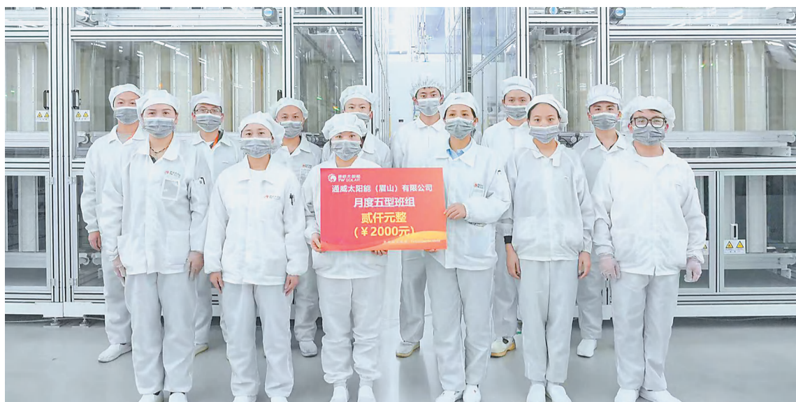
眉山公司电池三厂C班团队合影