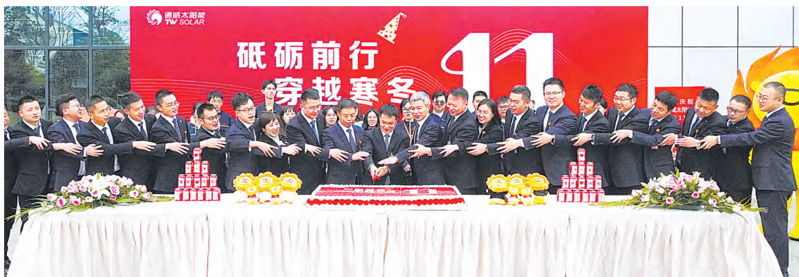
眉山公司管理团队与员工代表共享成长喜悦