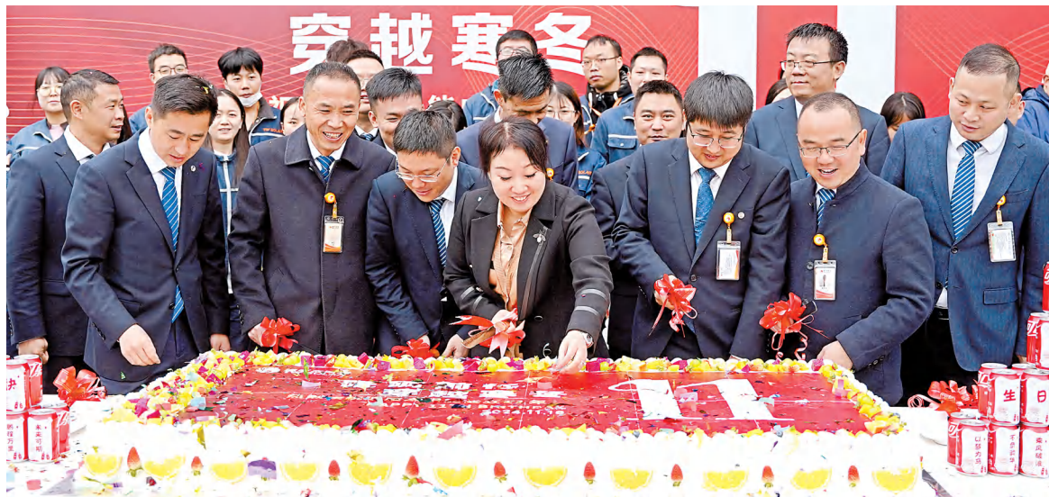
通合公司管理团队与员工代表共享成长喜悦

“祝通威太阳能11岁生日快乐!”共享生日蛋糕环节将庆典推向高潮,管理团队与员工代表共同切开蛋糕,传递祝福与希望。现场温馨与欢乐交织,共同期待通威太阳能更加美好的明天。