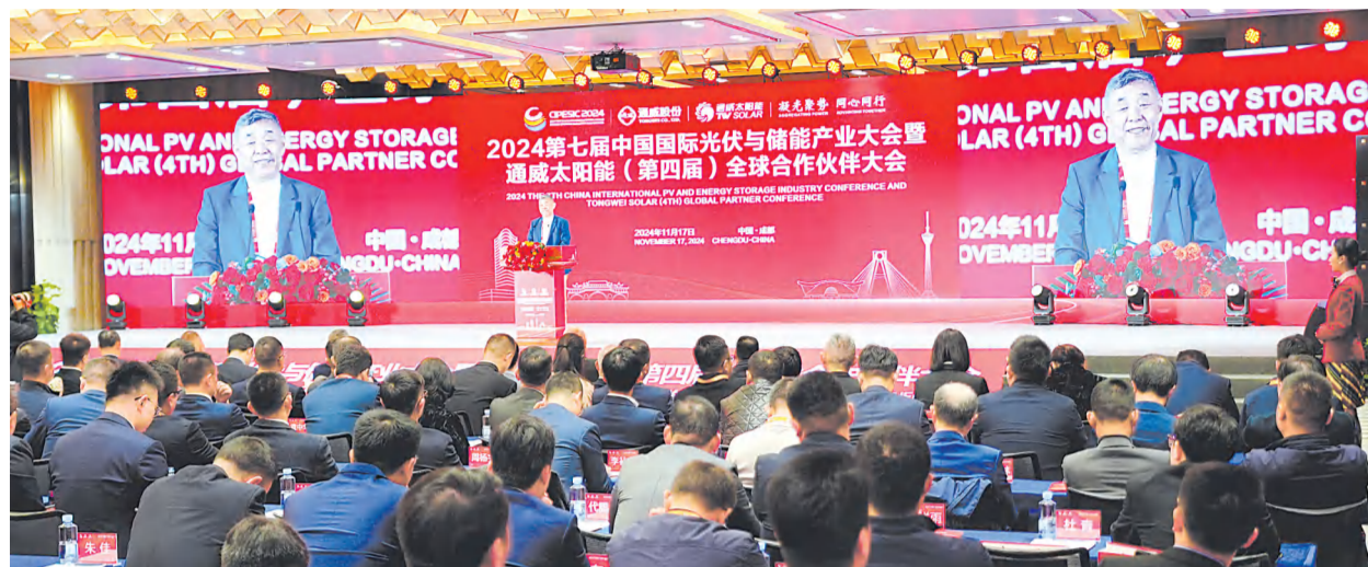
2024 第七届中国国际光伏与储能产业大会暨通威太阳能(第四届)全球合作伙伴大会现场