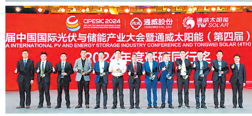
砥砺前行颁奖现场