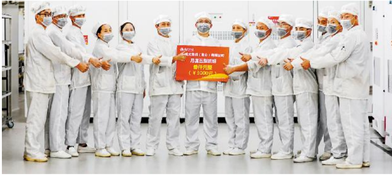
眉山公司电池三厂A班团队合影