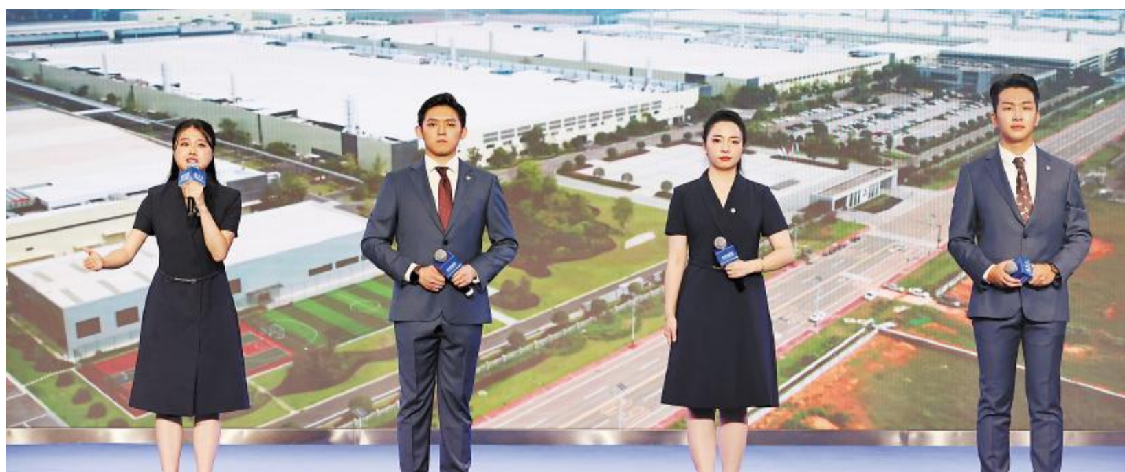
通威太阳能代表队朗诵《未来之光 通威力量》

9月14日,通威太阳能各公司有序开展中秋文化长廊活动,吸引了众多员工积极参与,现场洋溢着浓浓的节日氛围。活动内容丰富多彩,设置了包括打卡集赞“挣”积分、花灯猜灯谜、空中揽月、海底捞月、趣味赶动物等多个趣味环节。每个活动区前,员工们有序排队,竞相参与,现场欢声笑语,氛围浓厚。在猜灯谜的摊位前,员工们投入解题,争相抢答;在趣味赶动物的环节中,大家更是玩得亦乐乎。除中秋文化长廊活动外,各公司还开展了冰皮月饼DIY、食堂赠汤、趣味套圈等活动,进一步营造浓厚节日氛围,传递了公司的关怀与温暖。