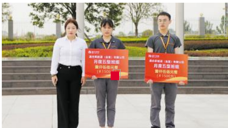
通德公司表彰现场