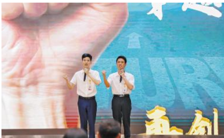
演讲比赛选手激情演讲

质量风险、评定质量能力奠定了坚实的知识基础。未来,通威太阳能将继续推出质量大讲堂系列主题培训活动,致力于赋能员工多维度成长,不断提升其专业能力,以持续改进质量管理体系,实现公司与客户共赢发展的长远目标。