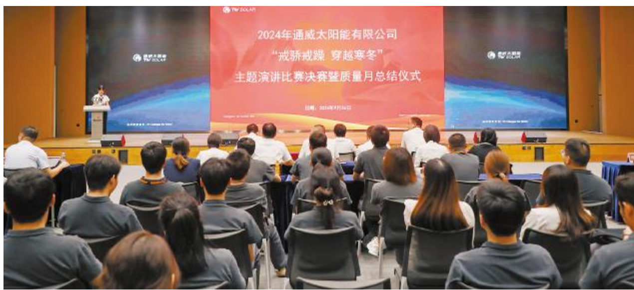
2024 通威太阳能“戒骄戒躁 穿越寒冬”主题演讲比赛决赛暨质量月总结仪式现场