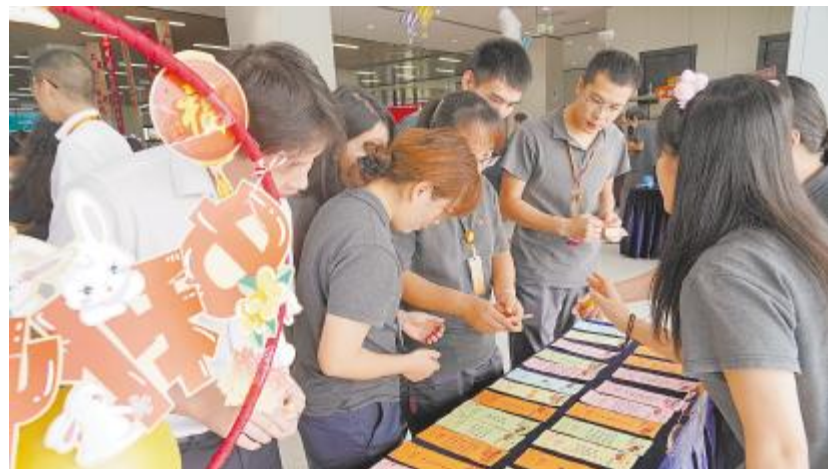
中秋文化活动,员工们积极参与游园会各项小游戏