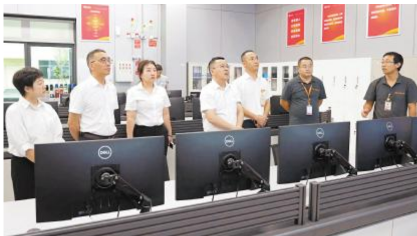
管理团队一行在通合公司听取厂务系统运行情况汇报

慰问期间,管理团队深入切片、电池生产一线,实地检查了包括生产车间、智能仓库、纯电站、特气站、化学品仓库等多个关键区域。检查现场,管理团队多次强调,安全生产不仅是企业