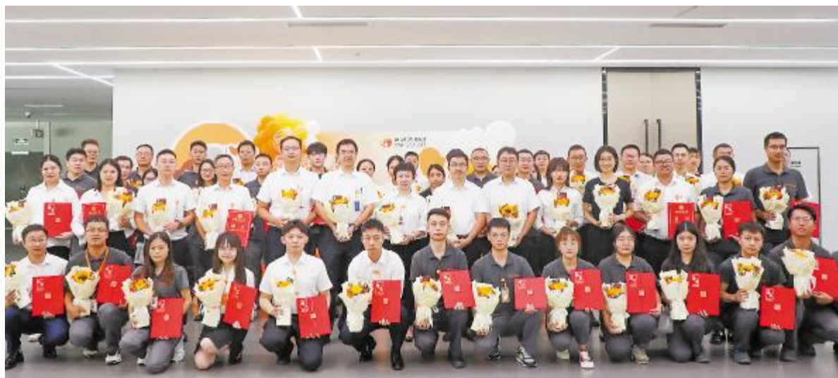
通威太阳能 2024 年讲师授聘暨教师节活动合影留念