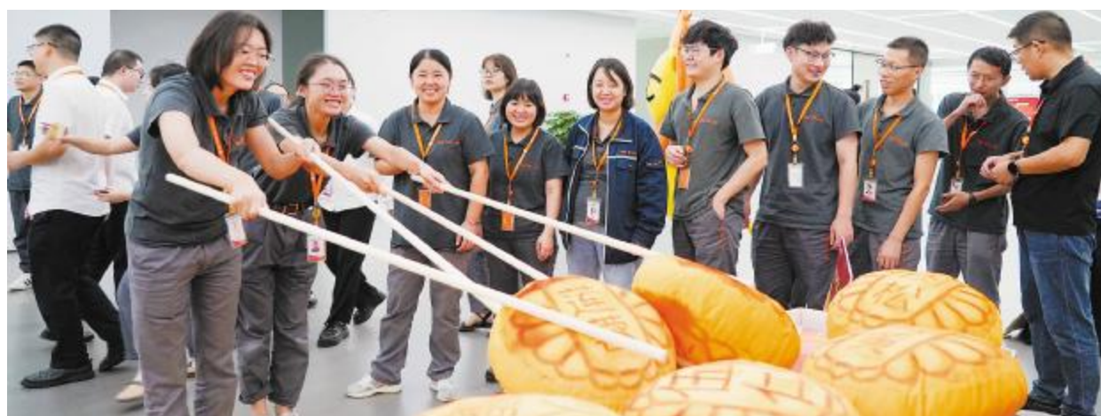
欢声笑语,氛围浓厚