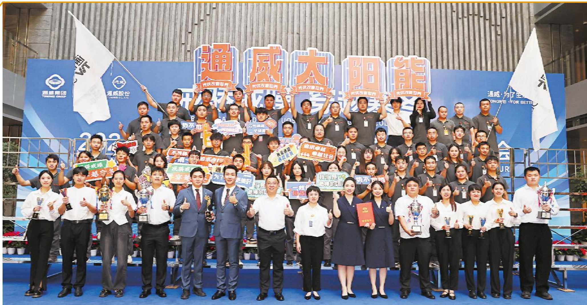
2024 通威集团 42 周年庆暨企业文化诗歌朗诵会合影留念