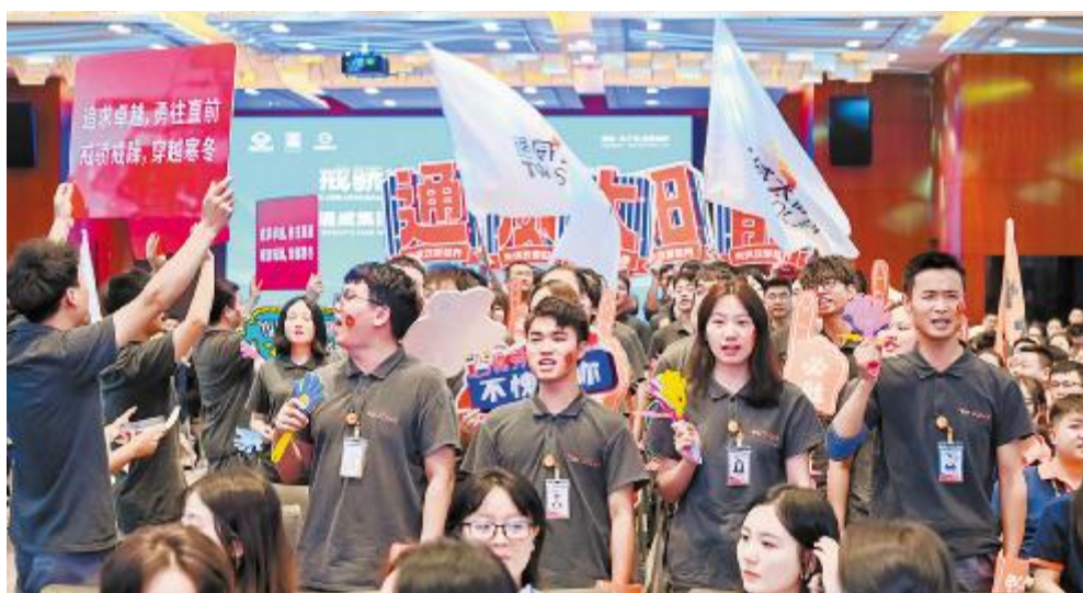
朗诵会现场,啦啦队助威