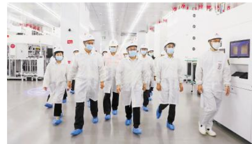
管理团队一行在成都公司生产车间进行检查慰问

合工作实际,深入开展降本增效工作,积极探索信息化及数字化的实践与应用,在数字化办公、自动化管理以及持续改善等方面下功夫,助力公司提质增效;在员工关怀方面,要真正做到“以人为本”,充分考虑员工