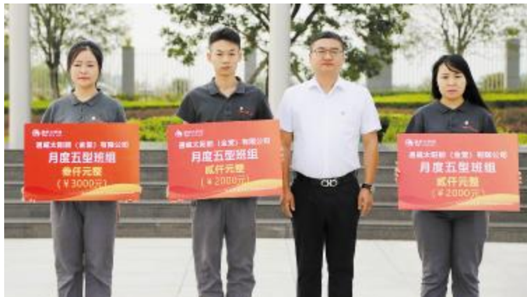
金堂公司表彰现场