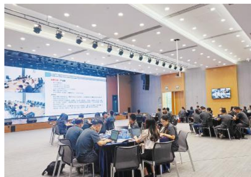
2024 年质量月主题活动——“质量大讲堂”现场

本次活动准备了丰富多样的精美奖品,以激励员工积极参与答题。员工们纷纷表示,通过此次活动的深入参与,不仅加深了对质量知识的理解,增强了质量意识,也展现了公司“人人关注质量、人人参与质量”的良好风尚。