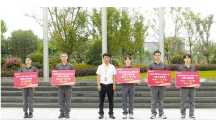
彭山公司表彰现场