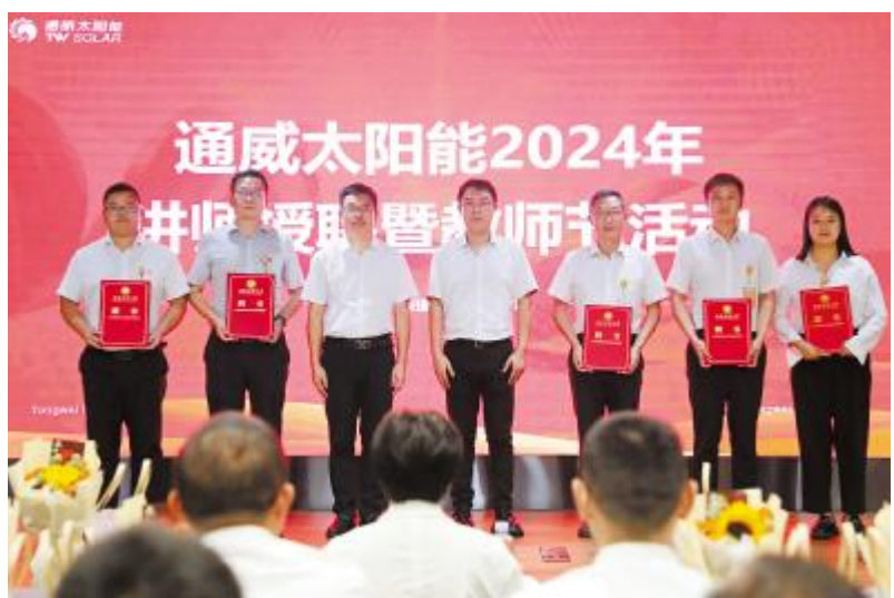
西南石油大学客座讲师授聘现场

在新能源产业蓬勃发展的背景下,企业与高校的合作日益成为推动技术创新和人才培养的重要途径。通威太阳能始终保持对员工发展的高度重视,以及公司在人才培养和文化传播方面的坚定决心。通过校企合作的方式,通威太阳能能为光伏行业的创新发展贡献了自己的力量,也对外树立了良好的品牌形象。未来,通威太阳能将进一步加大内训体系建设力度,优化内训管理体系,持续推动校企合作与产教融合,为公司的创新发展提供源源不断的人才支持。