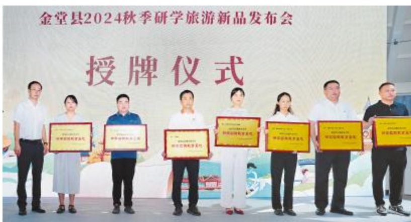
“金堂县首批中小学研学实践教育基地”授牌仪式

此次,通威太阳能多家公司成功上榜“2024年四川100强企业”“2024年四川制造业100强”两大榜单,彰显了通威太阳能在规模、效益、市场竞争力等方面的雄厚实力,更体现了政府及社会各界对通威太阳能各项工作成果的高度认可和肯定。