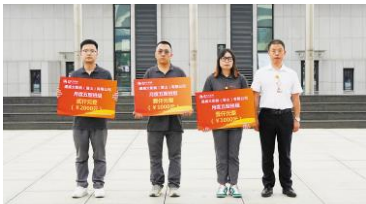
眉山公司表彰现场