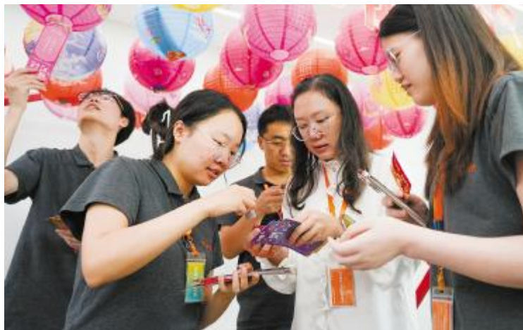
员工积极参与,现场洋溢着浓浓的节日氛围