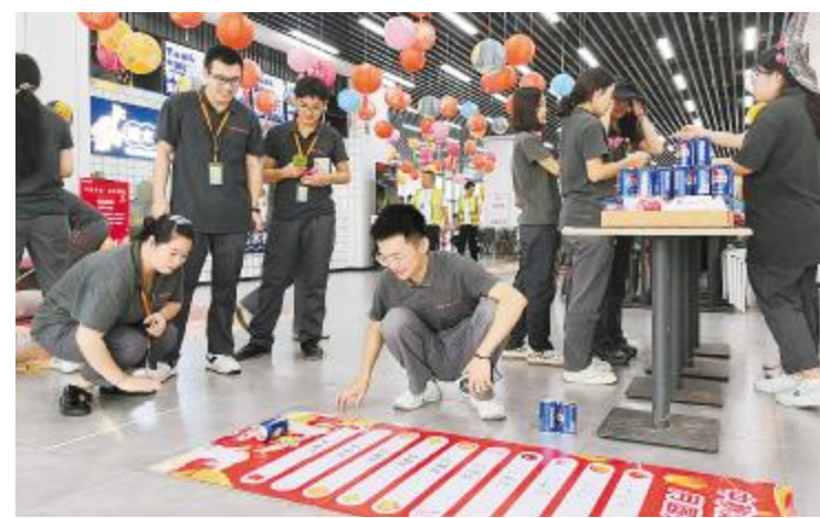
员工们参加“滚滚乐”欢乐抽奖