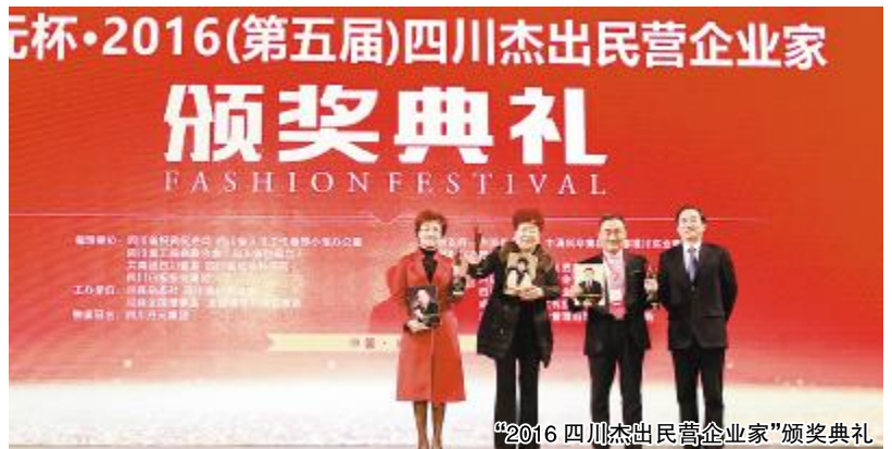
“2016四川杰出民营企业”颁奖典礼

一系列荣誉的获得,是近年来通威农业、新能源双主业蓬勃发展的生动体现和真实写照。在当前经济下行的趋势下,不少企业举步维艰,通威集团在关乎全人类生存发展大计的农业和新能源领域取得了一个又一个辉煌,创造了一个又一个行业第一。