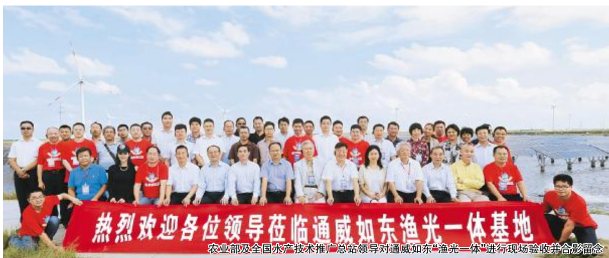
热烈欢迎各位领导莅临通威如东渔光一体基地 农业部及全国水产技术推广总站领导对通威如东“渔光一体”进行现场验收并合影留念