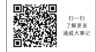
扫一扫 了解更多 通威大事记

6月22日,在2016年中国500最具价值品牌发布会上,通威集团连续第13年入围,品牌价值突破400亿元大关;8月25日,全国工商联发布“中国民营企业500强”榜单,通威集团凭借532.11亿元营收再次入围,并入围“中国民营企业制造业100强”榜单,位列入围企业首位。11月25日,第五届中国上市公司领袖峰会上,十一届全国政协常委、通威集团董事局刘汉元主席荣获“中国上市公司最佳董事长”殊荣。11月30日,在四川省加快推进全省民营经济工作大会上,通威集团及旗下永祥股份荣膺“四川省优秀民营企业”殊荣,通威集团更是位列榜单首位。一系列荣誉的取得,标志着通威集团在2016年复杂的宏观经济形势及内外环境考验下,继续逆势发力,书写了又一辉煌篇章,进而得到行业及社会各界的高度认可与肯定。