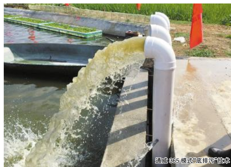
通威865模式“底排污”技术

(3)数据记录 养殖过程中要做好数据的记录工作,填写养殖日记,每天上午9:00和下午17:00测量水温及溶氧,每半月测量水体的氨氮、亚硝酸盐、pH值等常规的水质指标。