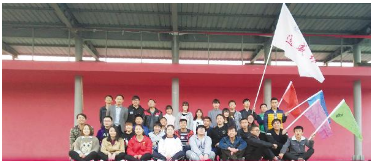
长江大学“通威班”选拔仪式暨素质拓展活动 拓展活动合影留念

本报讯(通讯员 刘育琴)校企合作,共助人才成长。校企合作班已经成为企业引进人才最主要的通道之一。“通威班”的成立既是宣传企业,也是给学生提供了解企业的舞台。