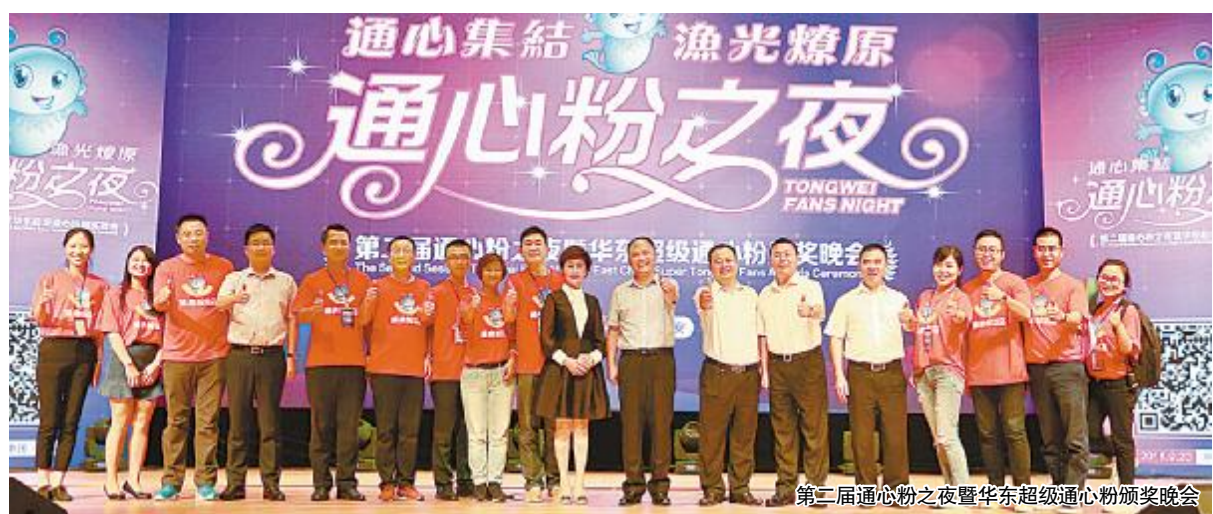
第二届通心粉之夜暨华东超级通心粉颁奖晚会