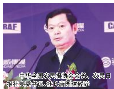
中华全国农民报协会会长、农民日报社党委书记、社长唐国结致辞