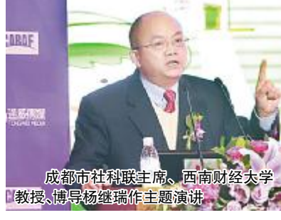
成都市社科联主席、西南财经大学教授、博导杨继瑞作主题演讲