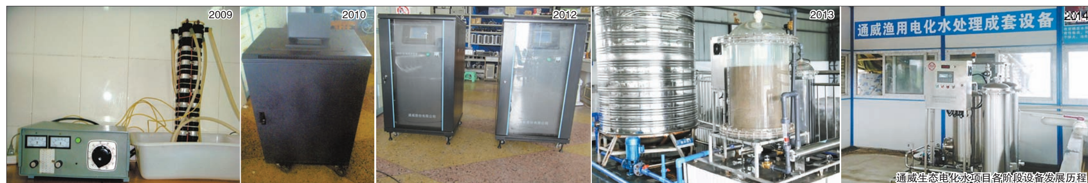
通威生态电化水项目各阶段设备发展历程

艰难困苦,玉汝于成。集团董事局刘汉元主席曾多次指示:“电化水项目,值得研究一辈子、几辈子。”为此,股份技术体系设施渔业工程研究所勇担重任,肩负起生态电化水项目的研究任务。在“敬业创新、大气大为”工作观念的指导下,设施渔业工程研究所顶烈日、战酷暑,不断创新环保渔业设施、工程,在“生态电化水项目”、“池塘底排污水质改良技术”、“网箱鱼体排泄物回收系统”等多项研究中,取得了累累硕果,获得了4项专利和省政府科技成果奖。这些技术可以有效地防治水产养殖的内、外源性污染,在彰显了通威科技实力的同时,也凸现了通威的社会责任感和行业使命感。