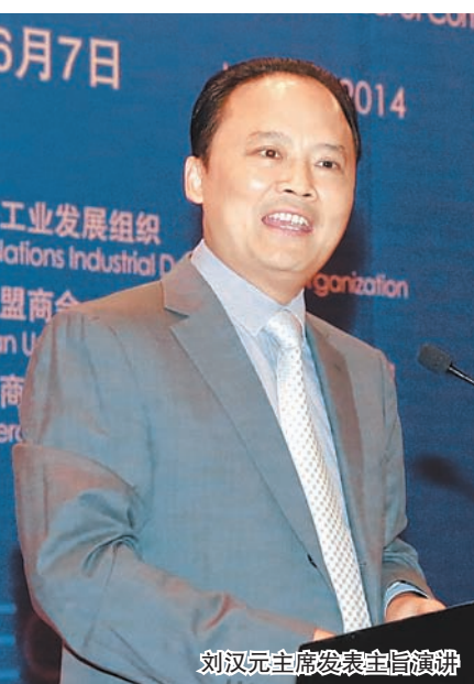
刘汉元主席发表主旨演讲