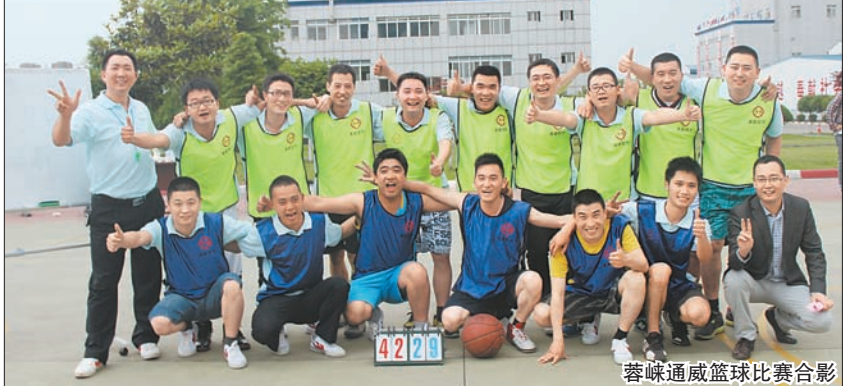
蓉味通威篮球比赛合影

本报讯(通讯员 蔡菲)为彰显通威预混料雄厚的科技实力,提升通威文化与品牌形象,进一步扩大市场规模,深化品牌推广,动物营养公司官方微信于7月1日正式上线。用户只需在手机微信“添加朋友”中查找公众账号“通威预混料”(TONGWEI-PREMIUM),即可添加关注。这一官方微信平台将作为动物营养公司对外宣传和品牌传播的重要新媒体平台之一,主要分享技术、管理、信息、动态等方面内容。