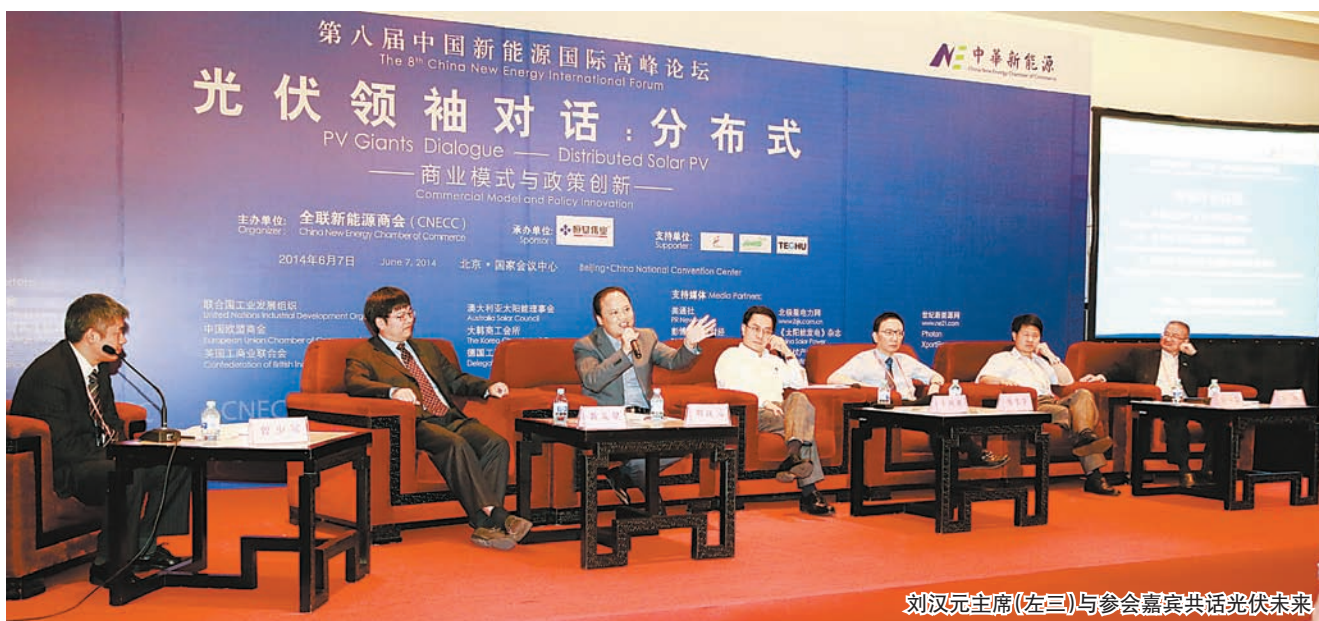
刘汉元主席(左三)与参会嘉宾共话光伏未来

本报讯(通讯员 袁敏)6月7日,第八届中国新能源国际高峰论坛在国家会议中心隆重举行。本次论坛的主题是“生态文明与新能源革命”,旨在讨论如何实现生态文明建设与新能源产业共同发展。全国政协常委、全国工商联新能源商会常务副会长、通威集团董事局刘汉元主席,汉能控股董事局主席李河君,恒基伟业董事长张征宇