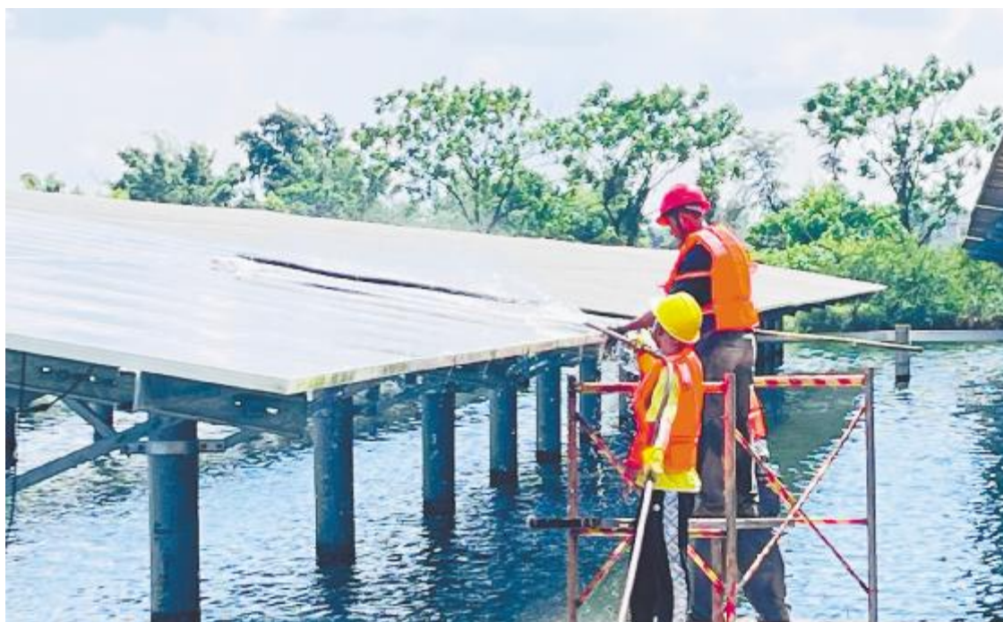
头顶烈日,抓紧清洗,保发电