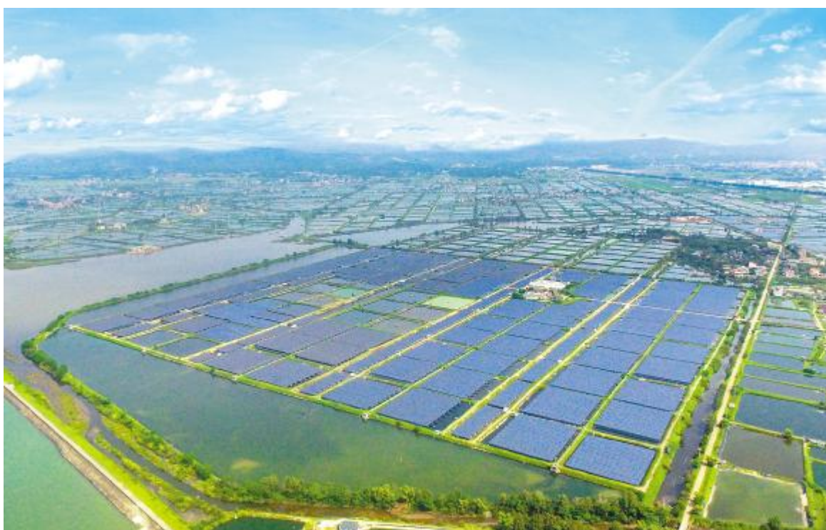
通威东兴“渔光一体”基地