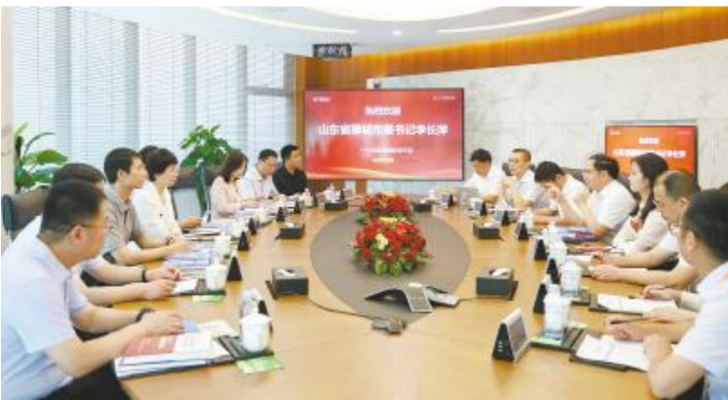
山东省聊城市委书记李长萍莅临通威考察