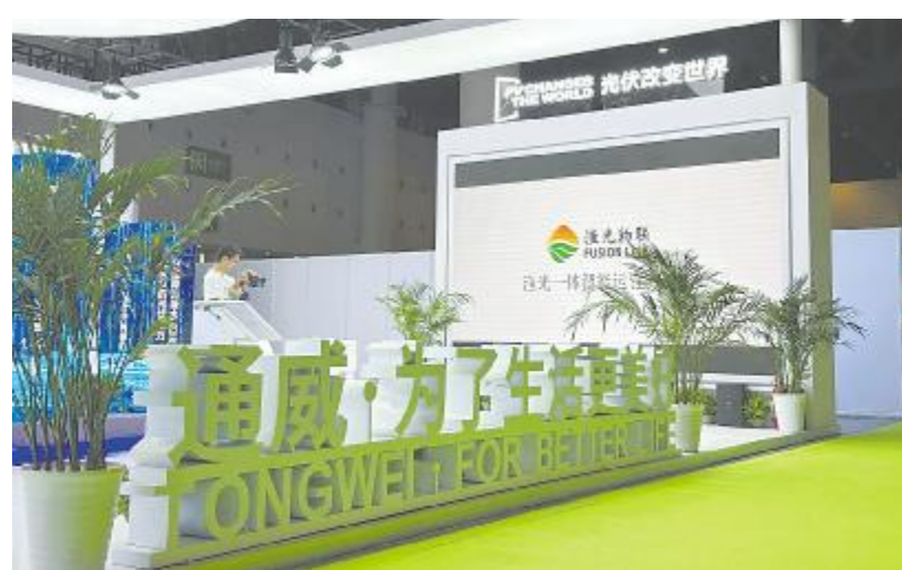
渔光物联亮相第四届中国环博会成都展

未来,渔光物联将持续践行绿色低碳理念,助力现代化产业体系加快建设,为中国和全球“双碳”目标实现作出更大贡献。