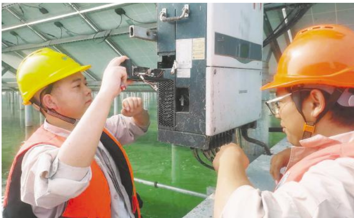
设备维护,保障电站安全