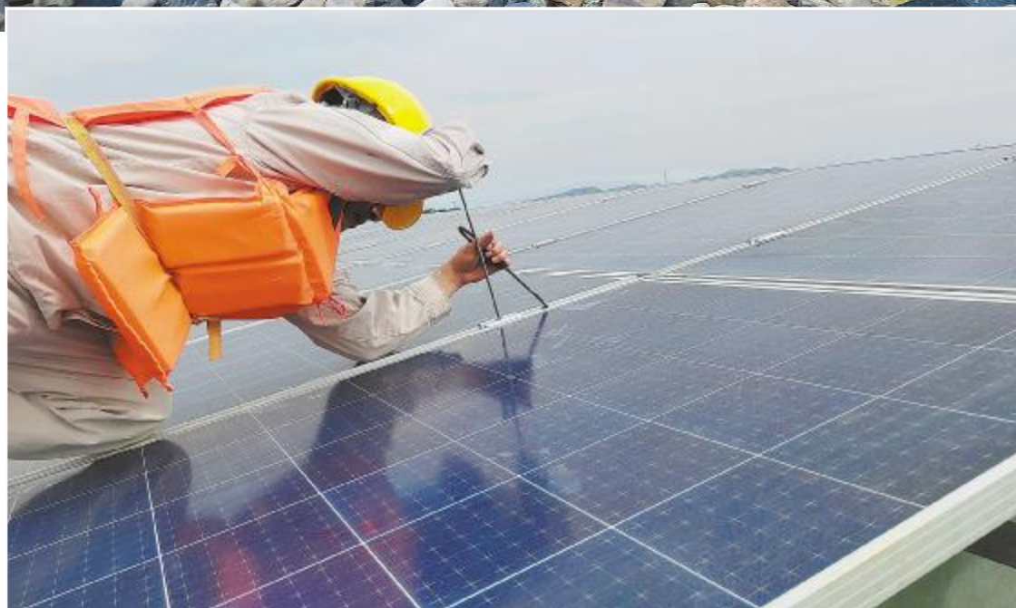
加固光伏板,应对台风天气