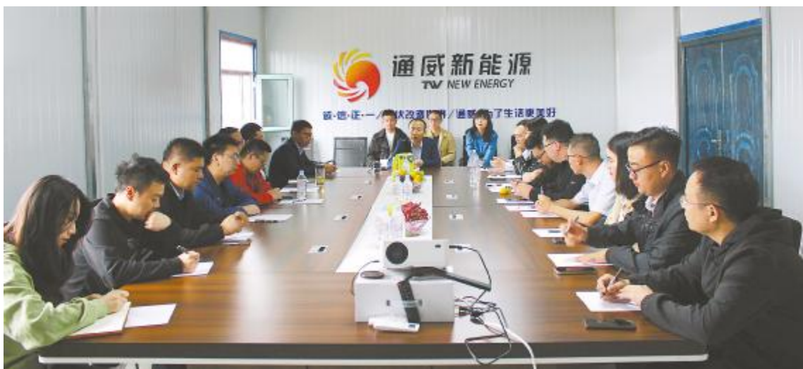
一线茶话会,倾听员工心声