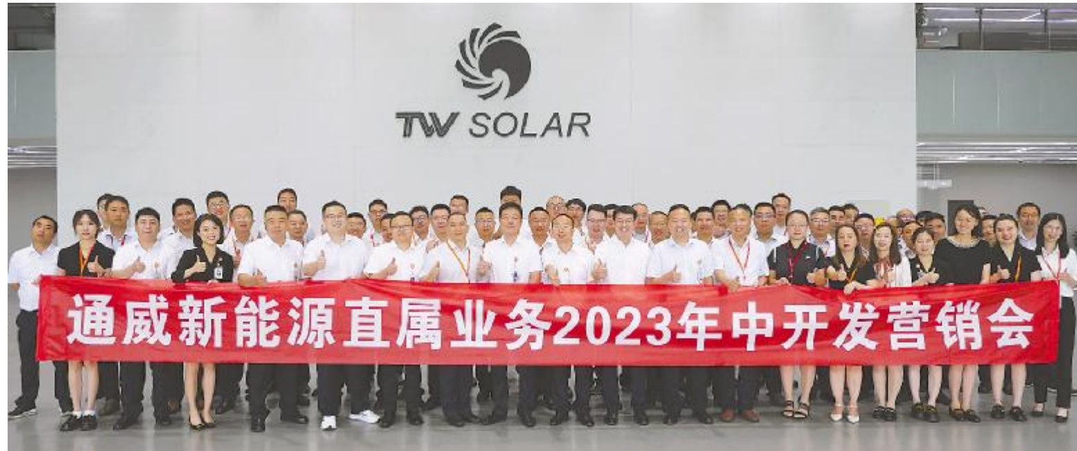
通威新能源直属业务召开2023年中开发营销会