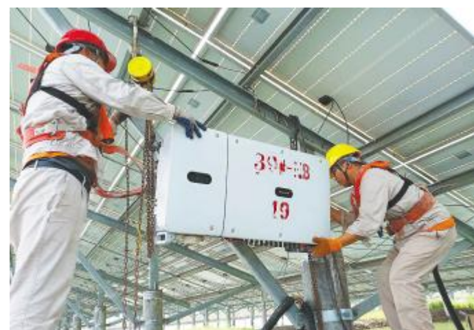
冒着高温,及时更换设备