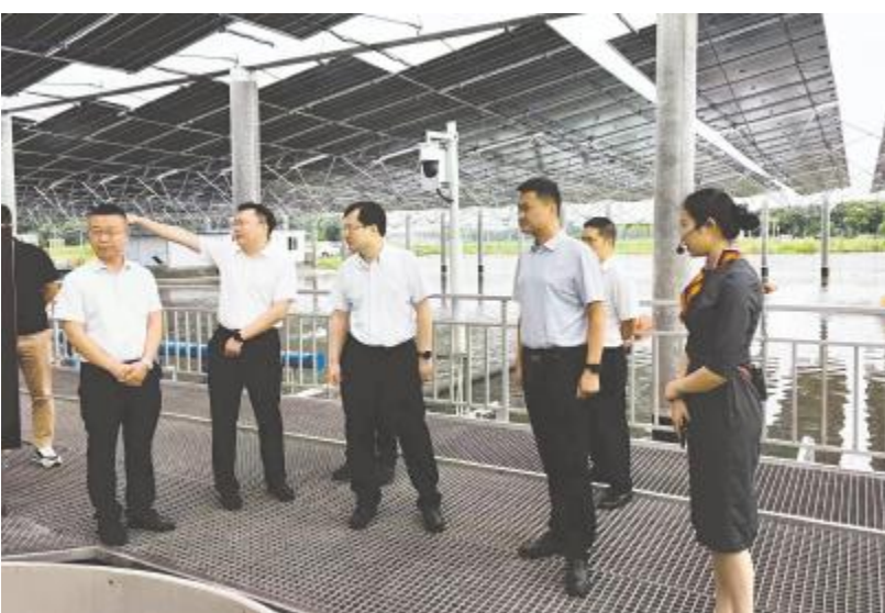
湖北省孝感市孝南区委书记夏齐勇参观通威渔光示范