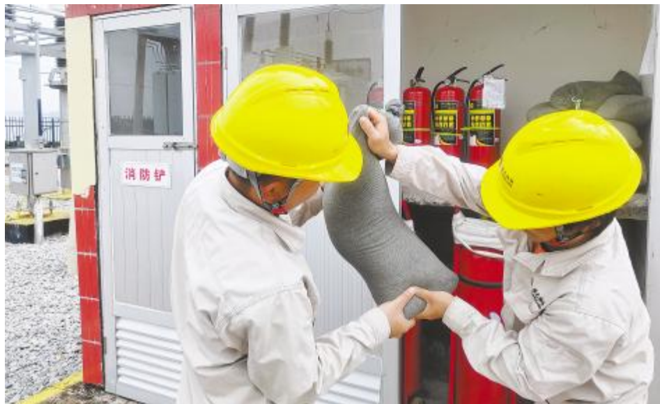
备齐防汛物资,做好应急响应