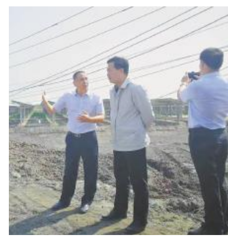
奋斗在项目开发一线

效率优先、阳光正向、监督保障,每一天,每一位平凡的通威人,在平凡岗位上夙兴夜寐,跟上公司稳健快速发展步伐,发展到哪里,工作就开拓到哪里,全力支持公司的快速发展,全力为“通威速度”“全球速度”保驾护航。