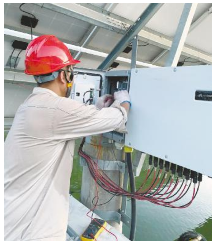
认真工作,汗流浹背浑然不知