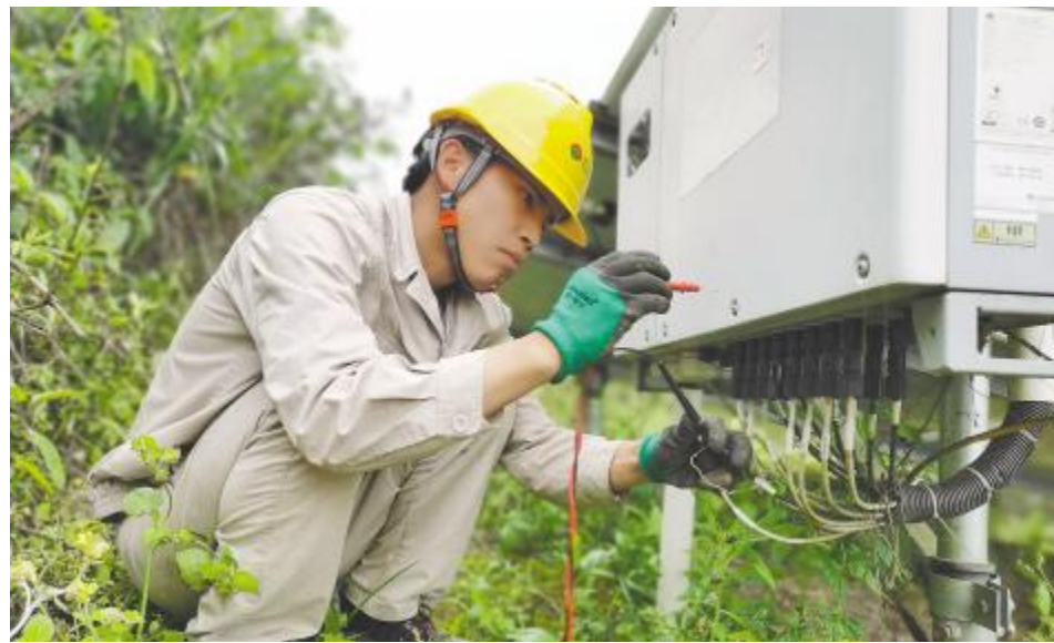
巡检设备,一丝不苟

受全球气候变暖 and 厄尔尼诺现象影响,今年入夏以来酷热席卷北半球大部分地区,多地高温纪录被刷新。世界气象组织数据显示,6月全球平均气温创下历史最高纪录,且创纪录高温在7月仍持续发生,短期内未见缓解迹象,给电站运维带来极大的“烤”验。同时,进入7月,台风天气频繁发生,对电站运维提出了更多、更高要求。渔光物联运维人坚守岗位,拼搏奉献,加大设备运维及治理力度。巡检走在前,缺陷早发现,力争在迎峰度夏期间夯实巡检成效,切实提升电站防御极端天气灾害水平,奏响安全生产之歌。正是这样一群默默坚守付出的追光者,在烈日下顶峰应“烤”,积极应对台风天气,勇敢担当,将辛勤工作的滴滴汗水,化作用电高峰时的阵阵清凉。肩上有责任,心中有担当。渔光物联运维人用专业塑造品牌信誉,用敬业为电站保驾护航。