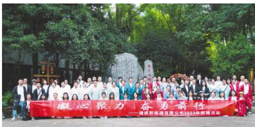
通威新能源2023半年度团建活动合影留念