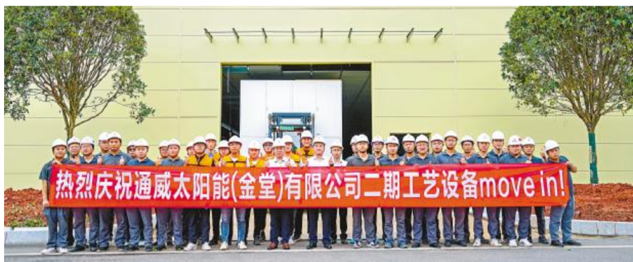
通威太阳能金堂基地二期项目设备顺利进场合影留念

通威太阳能金堂基地二期项目的顺利开展,是公司进一步实现“打造世界级清洁能源企业,让太阳能造福人类”愿景的新动能,是通威作为链主企业发挥聚合带动效应,推动重点产业降本增效和集聚提能的新起点。2022年,通威迎来40年华诞,在这个重要的发展节点,通威太阳能金堂基地新项目的成功建设是为通威集团献上的最好祝福,祝愿集团蓬勃发展,再创辉煌。