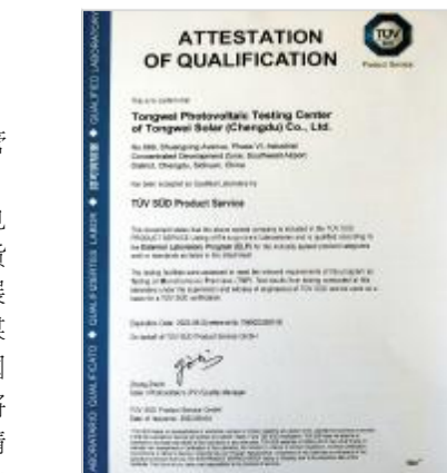
光伏检测中心获TUV南德目击实验室认可资质证书

通威太阳能作为全球最大的太阳能电池生产企业,连续6年稳居电池片出货量榜首,始终以全球视野聚焦企业发展态势,立足国内国际环境,研判市场,谋定而动,以期发挥企业最大价值,为中国企业贡献通威力量。通威太阳能将始终不忘“光伏改变世界”使命,持续精进管理,卓越发展,朝着世界级龙头企业和世界级清洁能源公司的宏伟目标不懈努力。