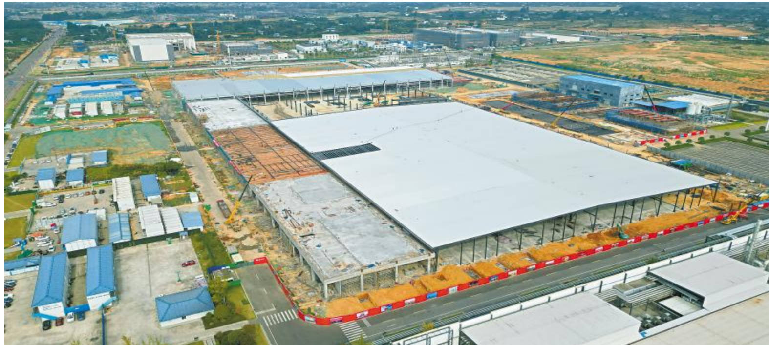
建设中的眉山基地三期项目