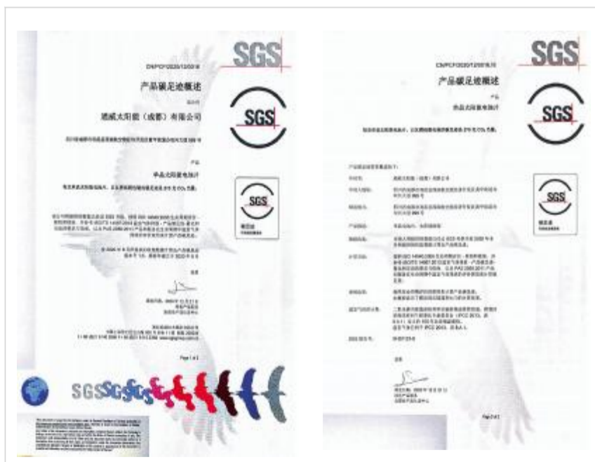
通威太阳能(成都)有限公司 SGS 碳足迹认证证书

未来,通威太阳能将始终坚持践行创新、协调、绿色、开放、共享五大发展理念,不断加大投入,采取措施,优化产品设计,改进制造工艺,创新管理模式,继续推动我国能源转型升级,助力“碳中和”目标早日实现。