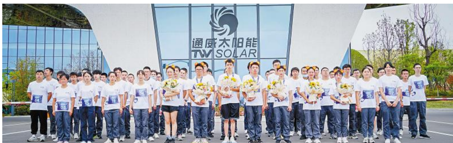
金堂基地参赛选手合影留念