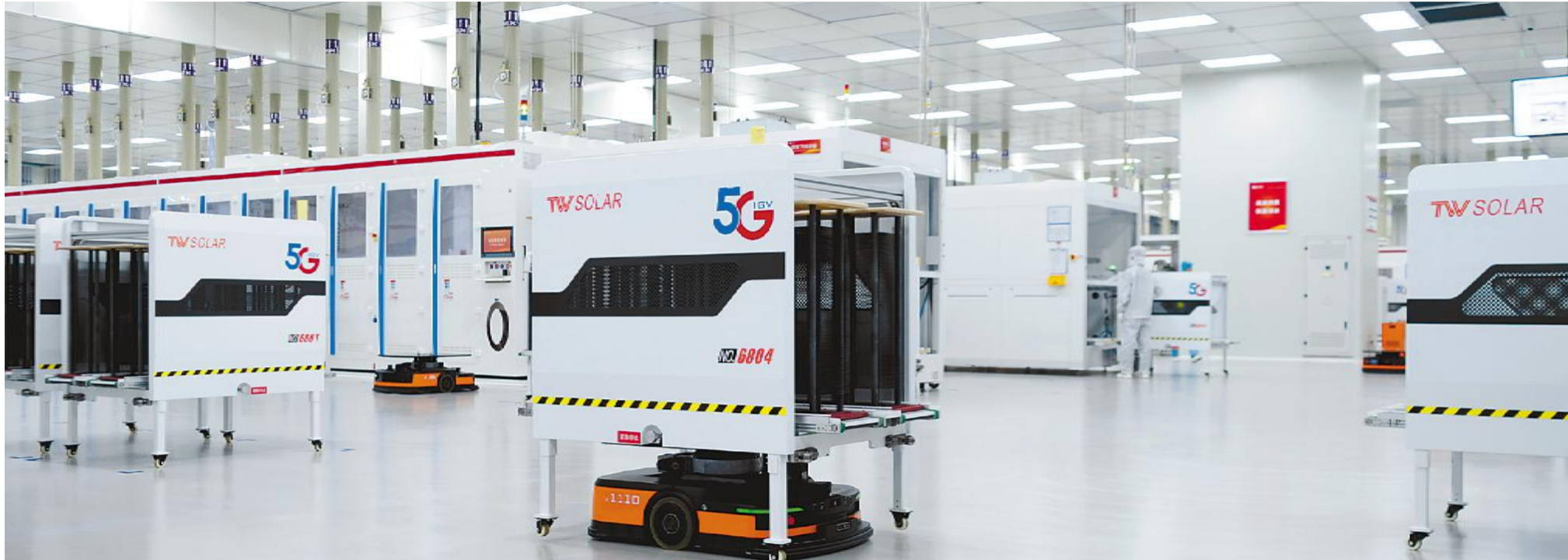
通威太阳能金堂基地 5G 车间