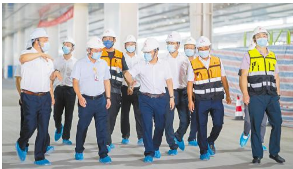
通威太阳能中高管团队深入施工现场查看工程进度