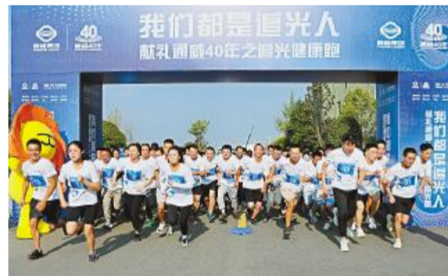
眉山基地追光健康跑活动起跑瞬间