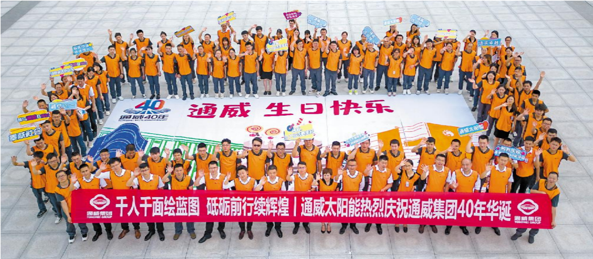
共绘主题画卷,祝福通威生日快乐