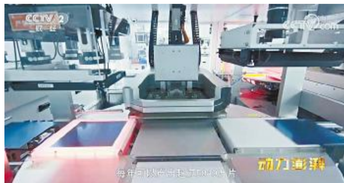
2021年5月18日,通威太阳能重磅登陆央视财经频道大型工业纪录片《大国重器》

40年来,通威人以善之心、至诚之心,与合作伙伴携手共进。未来的合作中,通威也将永远坚守这份信念,与合作伙伴建立互信、互谅、互利、互助的战略合作关系,为子孙后代留住青山绿水、蓝天白云,为了生活更美好,作出更大的贡献。