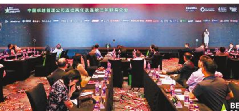
第四届中国卓越管理公司年度颁奖典礼现场