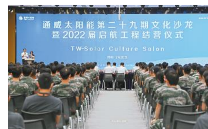
通威太阳能第二十九期文化沙龙暨2022届启航工程结营仪式现场

公司完善的人才选用、培养、激励、关爱机制,贯穿员工职业发展全周期,全方位助力员工突破自我,最大化实现自身价值和职业目标,多年来,还数次荣获“αi优质职场积极践行奖”“年度最佳雇主”“中国好伯乐”“大学生最喜爱雇主”等殊荣。未来,公司将进一步打造员工与企业“健康共生、成长共赢、财富共享、价值共享”的优质职场环境,树立优质职场榜样品牌,引导社会、企业、员工共建和谐、共赢的理想职场生态。