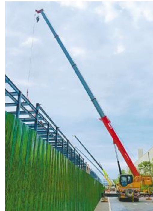
建设中的金堂基地二期项目