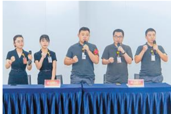
战队积极抢答竞赛题