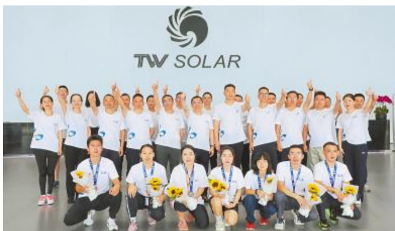
双流基地开展追光健康跑活动

心怀使命,向光而行。通威太阳能将以此次活动为新起点,在集团的带领下继续书写光伏志,勠力同心创辉煌,为“通威,为了生活更美好”的企业愿景而不懈奋斗,为实现“双碳”目标贡献通威力量,以更好的成绩献礼集团40年华诞。