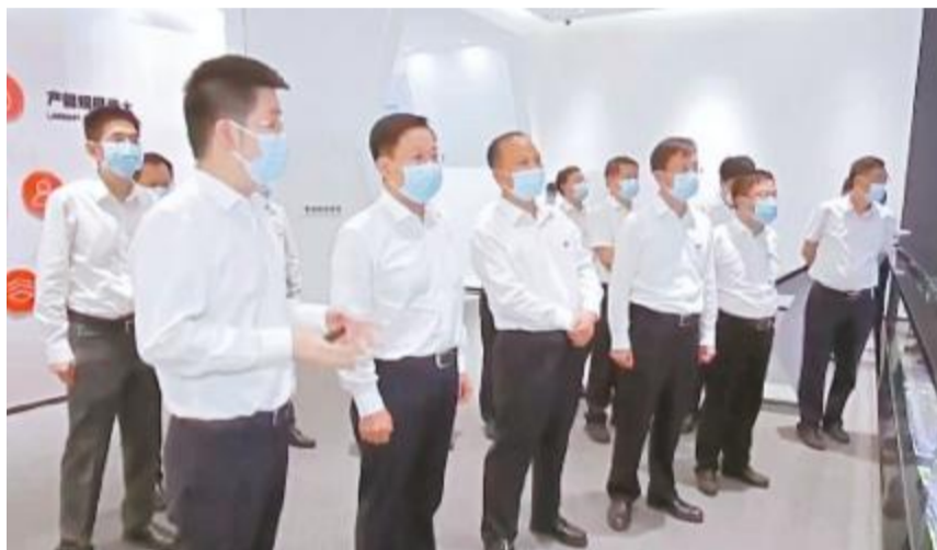
王晓晖书记听取通威太阳能发展成果汇报