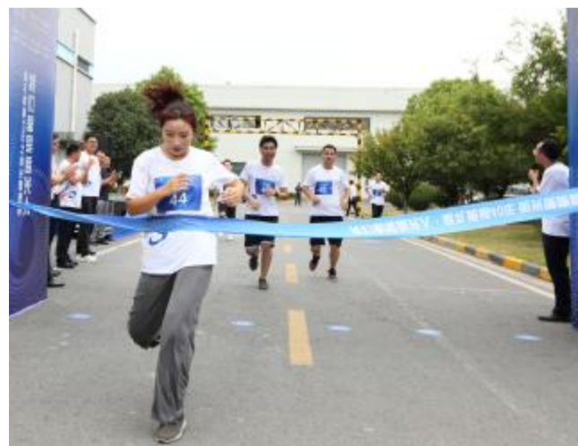
合肥基地选手冲刺瞬间