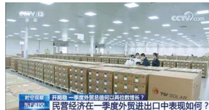
2022年4月13日,央视聚焦通威太阳能外贸出口优异表现