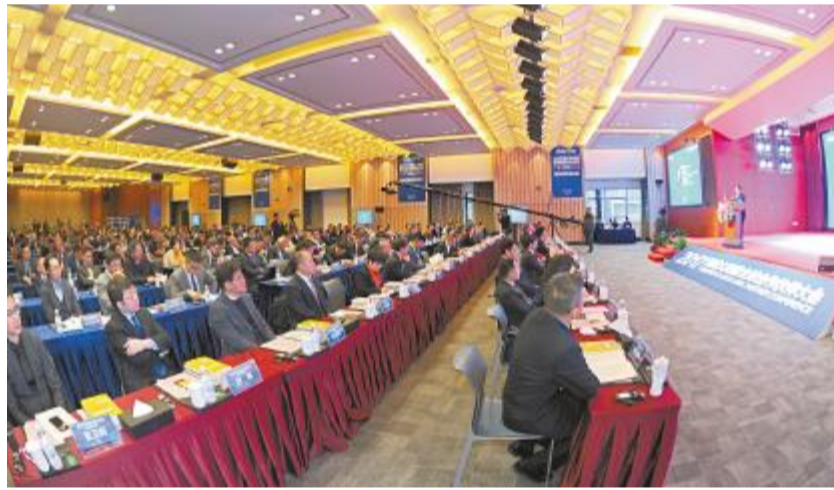
2017年12月1日,通威太阳能首届全球合作伙伴大会现场嘉宾云集

站在历史的关口,通威太阳能持续引领全球太阳能光伏智能制造发展,继续为推动光伏发电成本不断下降,推动“中国制造2025”实现,推动经济绿色可持续发展与全球“双碳”目标积极贡献通威力量。