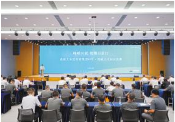
通威企业文化知识竞赛活动现场

5月至6月,通威太阳能组织万人学习企业文化活动。本次文化复训,使全体干部员工全面感知,通威文化始终贯穿于公司开拓奋进、飞跃向前的发展历程,有力肩负起了“方向标”“动力站”等诸多职能,更在日常工作中指引通威人在复杂多变、激烈残酷的市场中,始终不忘初心,坚定勇敢地朝着“追求卓越,奉献社会”的企业宗旨持续奋斗。