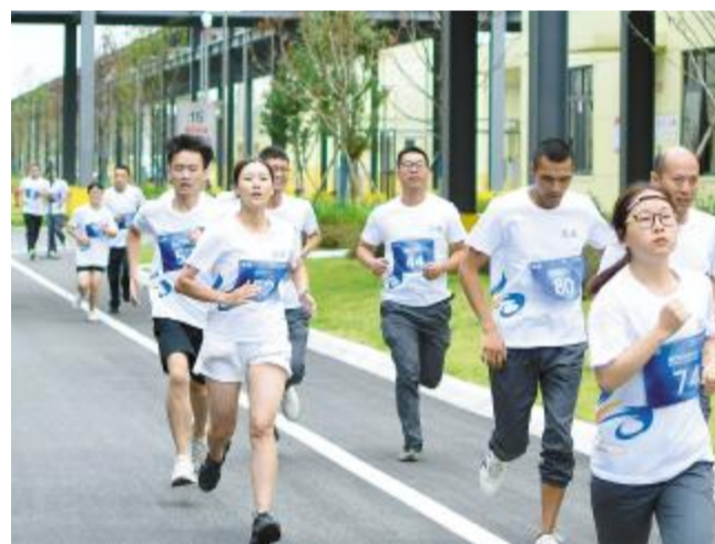
通合项目选手们竞相追逐