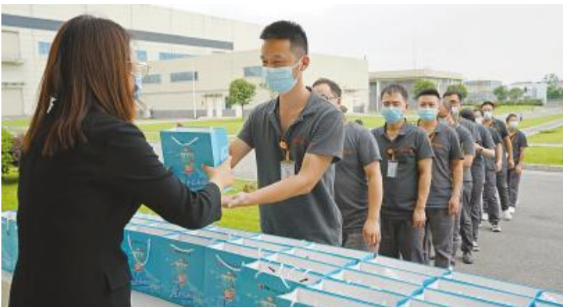
员工有序领取清凉礼包