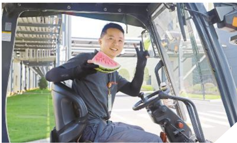
夏日清凉送到一线