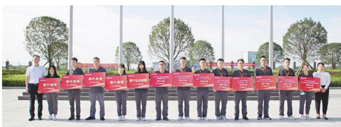
月度最佳五型班组金堂基地与通合项目颁奖现场