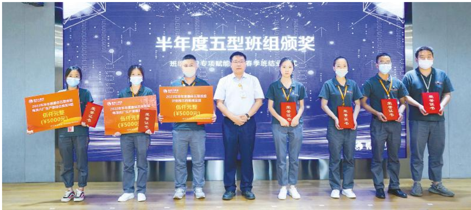
半年度最佳五型班组双流基地颁奖现场