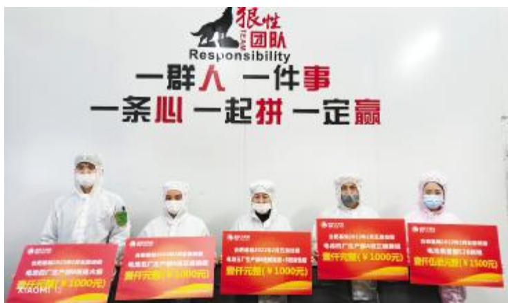
月度最佳五型班组合肥基地颁奖现场