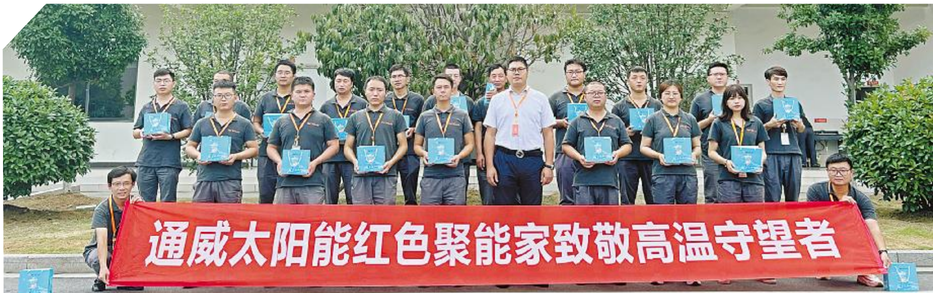
通威太阳能红色聚能家致敬高温守望者合影留念

同时,为表达对恪尽职守、坚守一线的广大民警官兵的敬意,进一步加强警民团结,共同构建和谐社会,双流基地组织开展辖区派出所民警慰问活动;为了进一步关心关爱公司高温作业人员,通威太阳能眉山基地工会联合眉山市总工会开展2022年夏日“送清凉”慰问活动。市总工会领导叮嘱,高温作业人员要增强自我保护意识,在做好本职工作的同时,注意防暑降温,确保自身的健康和平安。