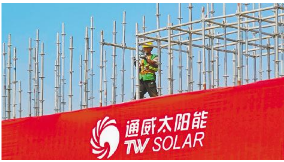
《安全重于泰山》眉山基地