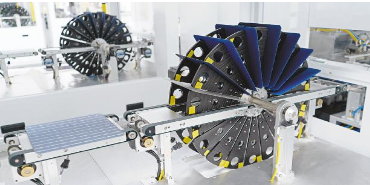
通威太阳能智能制造生产线