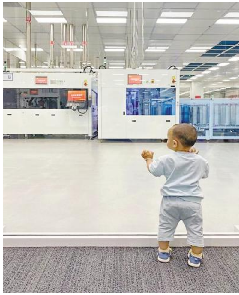
《希望传承》金堂基地

通威太阳能献礼通威集团40年,“美好生活记录官·定格我的通威记忆”主题摄影活动,7月优秀作品出炉,这里有专注、和谐、奋斗的人文之美,也有蓝色厂区、风雨彩虹的景色之美。让我们一起走进通威人专属的“通威记忆定格时刻”吧!