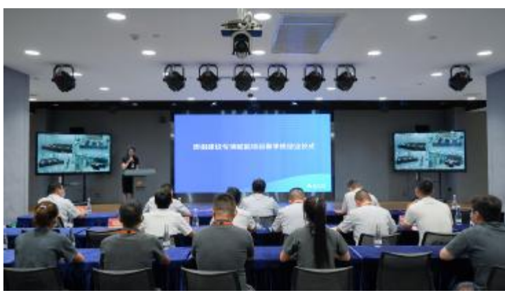
春季班结业仪式双流基地主会场