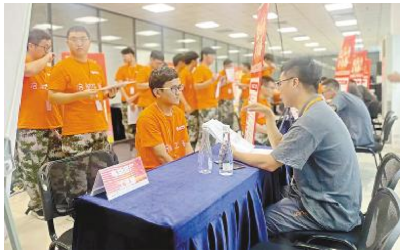
双选会现场,面试官与启航生交流

本次启航双选会的开展,不仅为用人单位储备了人才,更推动了岗位与专业的精准匹配,将用人需求和人才培养精准对接。未来,公司将持续关注本届启航生发展动态,畅通启航生职业发展通道,加强高素质人才队伍培养,为实现通威太阳能人才战略性发展作出重要贡献。