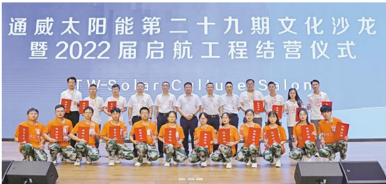
结营仪式颁奖现场

萧总在致辞中首先对此次启航集训营的取得成果给予高度肯定,并指出,启航集训作为启航生们职业生涯的开场,集训的 16 天弥足珍贵,大家经受住了来自心理、生理的诸多考验,显现出了敢打敢拼、坚韧顽强的可贵品质。希望大家能将启航精神延续,在工作岗位