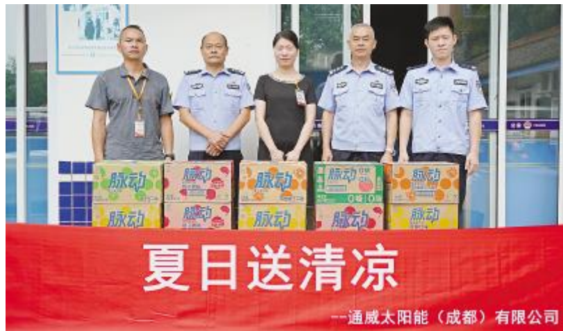
慰问一线公安民警