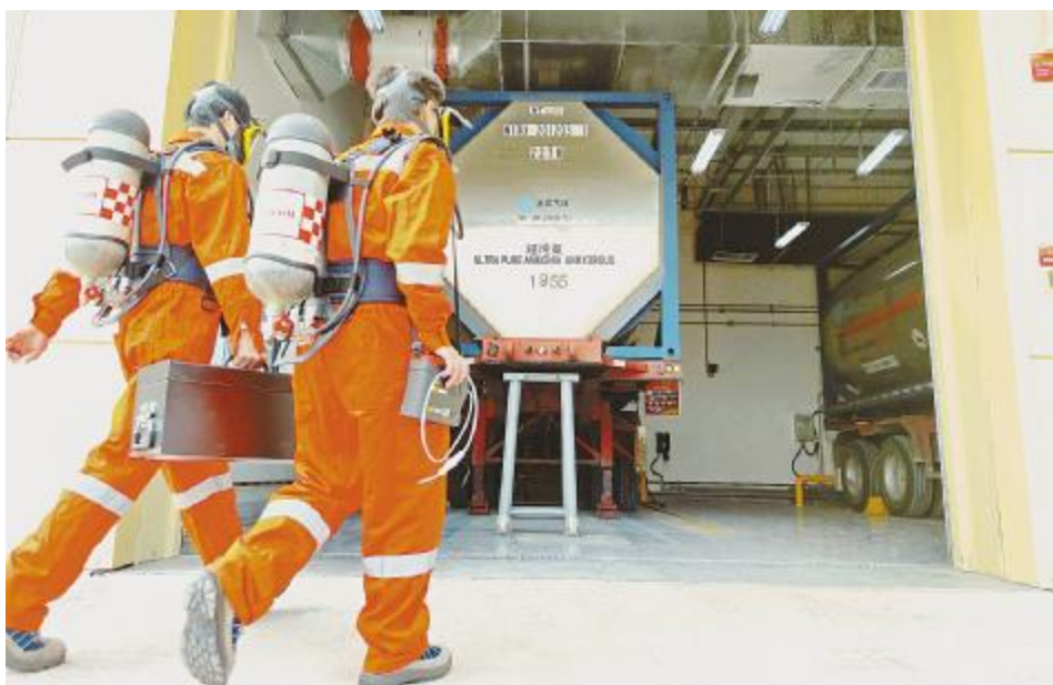
《安全武装》通合项目