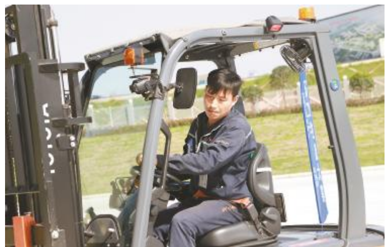
通合新能源“叉车技能竞赛”现场

“从比赛报名到比赛结束全程我都认真对待,不鸣则已,一鸣惊人,就是奔着第一的目标去的。模拟练习的时候我反复观看哪里会影响速度,怎么样去避免异常点,如何去解决,怎么和其他选手拉开差距,总结三句话:过硬的作风,正确的思维,科学的方法。”