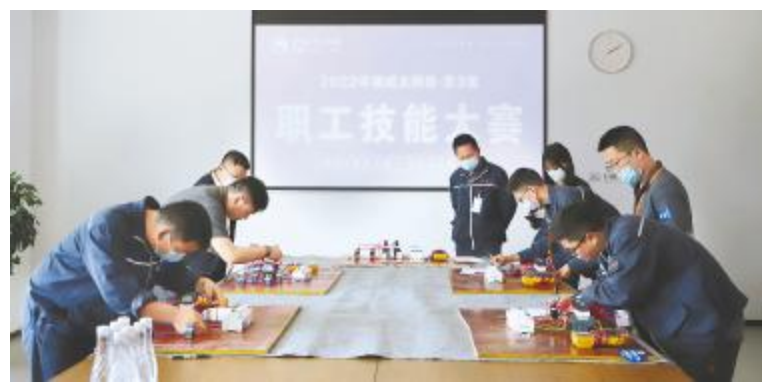
眉山基地“电工技能竞赛”现场