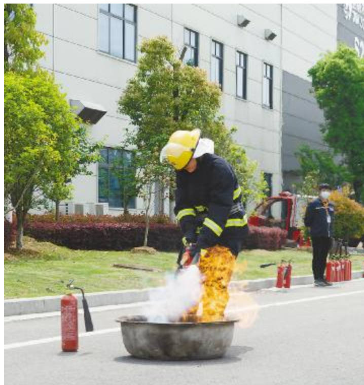
合肥基地“消防技能竞赛”现场