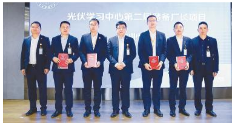
第二届储备厂长培养项目结业汇报现场