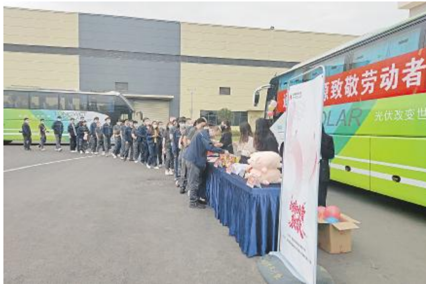
员工有序参与“劳动者致敬”交通车系列活动