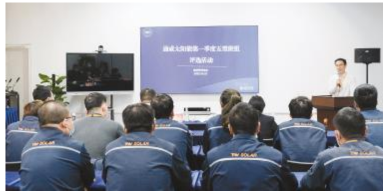
合肥基地五型班组季度评比活动现场