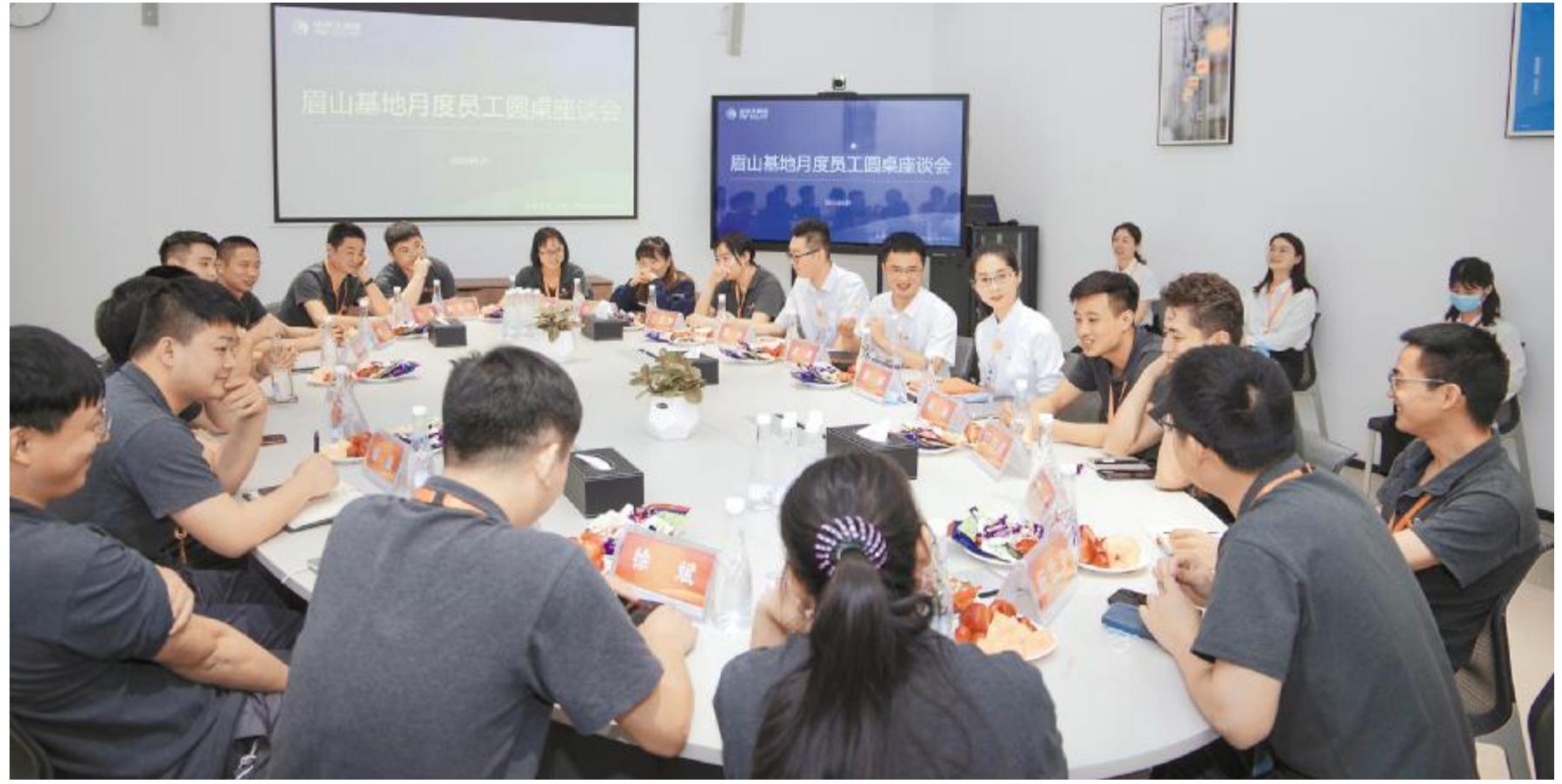
眉山基地圆桌交流现场