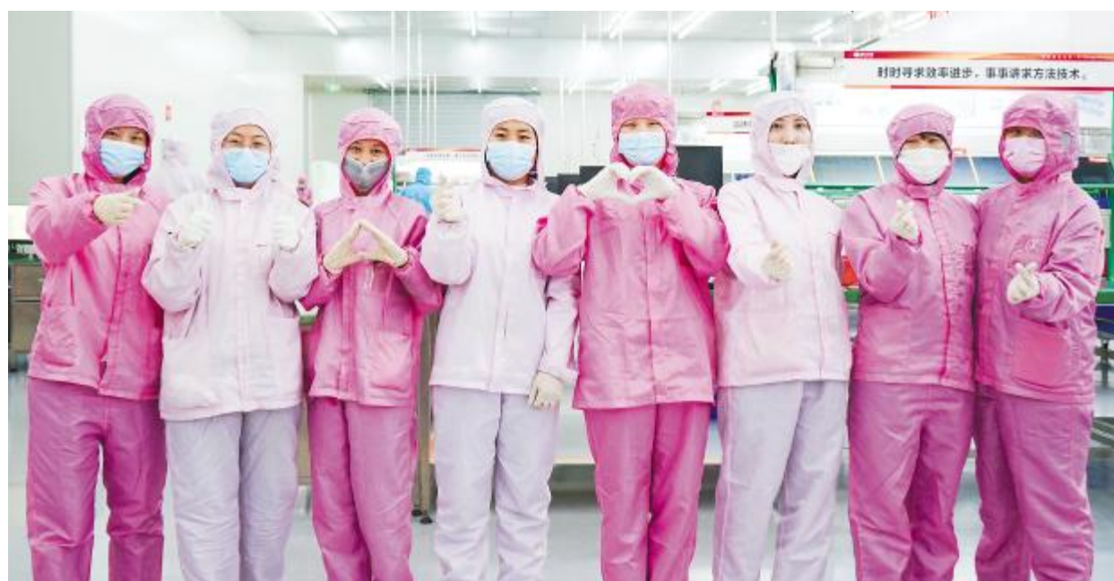
质量部团队花式比心,致敬青春梦想