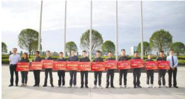
金堂基地、通合项目获奖团队代表合影

本季度五型班组评比,由各厂部先在一季度内月度五型班组中选拔出厂部季度优秀班组代表,各优秀班组对季度内班组建设目标、建设亮点、建设成果及未来计划等内容进行梳理,班组长代表将班组建设成果通过列数据、讲事实、展成果、提亮点的方式展开PK。评委根据汇报情况,结合班组建设五个维度进行评选,最终各基地综合评分分别决出一个最优班组,获评季度五型班组荣誉并享5000元/班组激励。