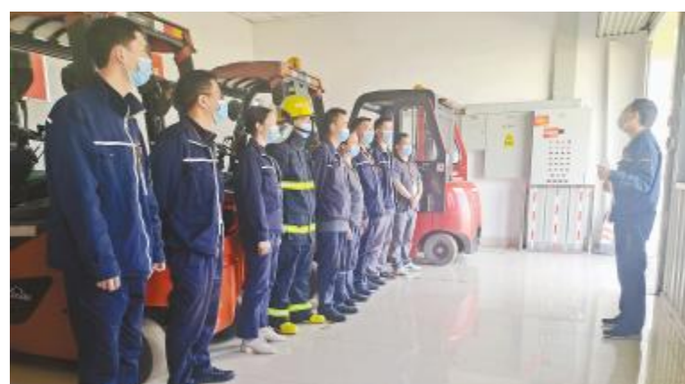
双流基地叉车火灾应急处置演练现场