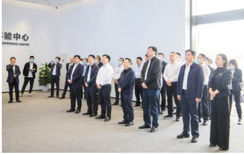
宜宾市委副书记、市长廖文彬调研眉山基地