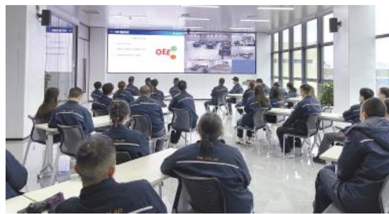
《生产效率提升-快速换型》面授课程现场