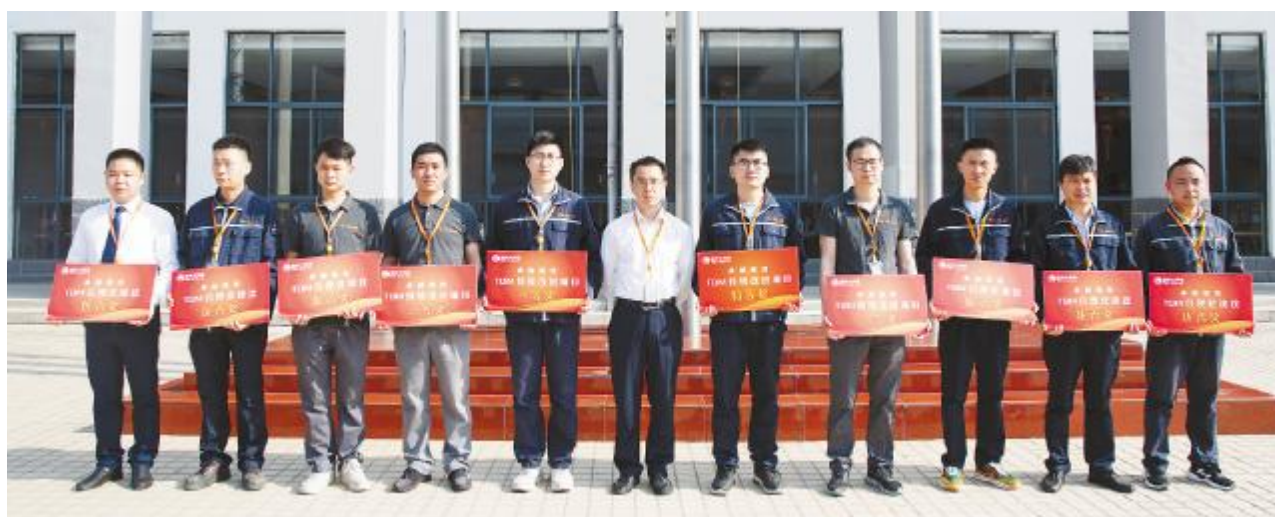
合肥基地第一季度 TQM 项目获奖者合影

提案 103 项,经财务核算年收益约 2026.6 万元,评定奖金 80000 元。