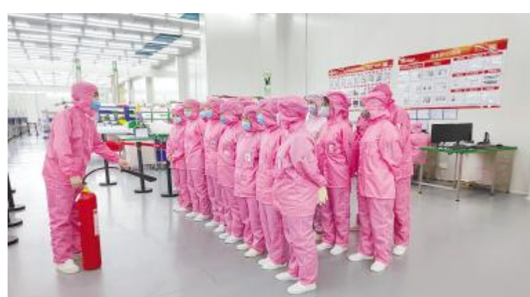
通合新能源基地安全隐患排查活动现场