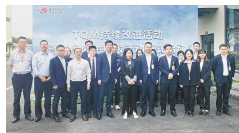
通合新能源 TQM 持续改进活动暨质量隐患提报活动启动仪式现场

未来,通合新能源将秉承“享受奋斗、拥抱危机、防范重安”的核心价值观,不断提高公司 TQM 质量管理实施水平,助力公司经营、管理水平、经济效益不断提升。