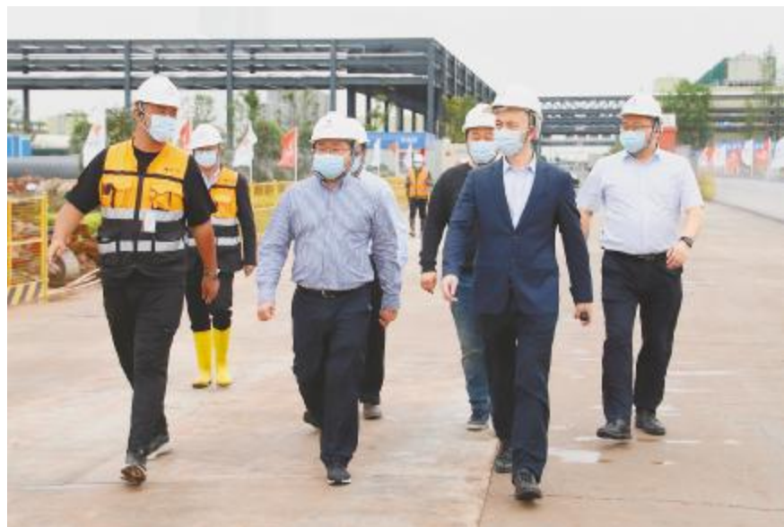
五一劳动节当天,通威太阳能高管团队慰问一线工作者