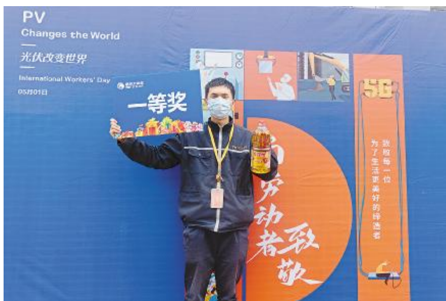
“致敬劳动者”活动现场,员工与战利品合影留念