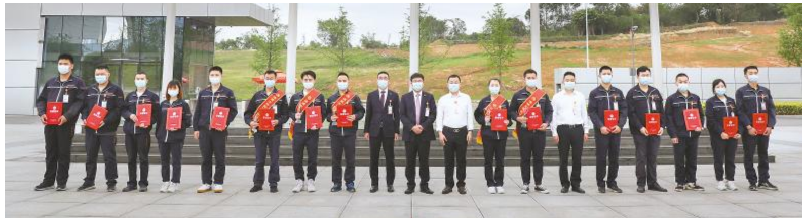
双流基地“最美工匠”获奖者合影

匠心聚,百业兴。通威太阳能将继续大力弘扬工匠精神,激励广大职工走技能成才之路,持续开展多种形式的技术比武活动与竞技交流活动,着力建设一支有知识、懂技能、敢创新的专业队伍,共绘通威太阳能美好蓝图。