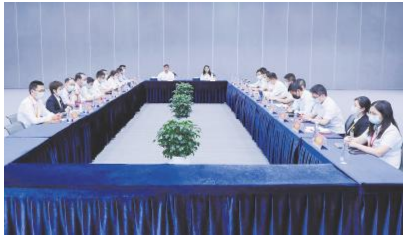
通威太阳能2022年第一季度管理研讨会现场

在下半场的议题研讨环节,公司中高管团队分为两组,分别就“降本增效”与“编制优化”两个议题展开讨论。降本增效组主要围绕指标现状、成果亮点、改进途径展开讨论,希望通过各基地相互的对比与学习,找出不足和差距,组员们群策群力、各抒己见,汇总解决方案。编制优化组以自动化技改、管理模式、规划设计为突破点,结合新老项目实际情况及经验,形成优化策略报告。最后,各组分别就改善措施、实施计划、资源需求形成简报,并