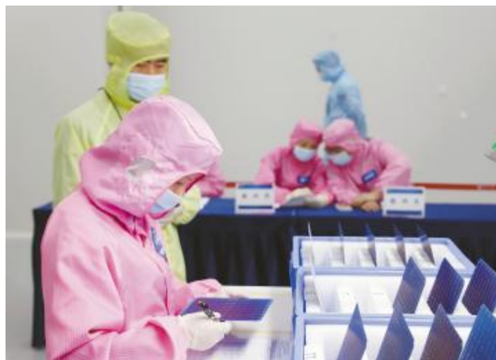
金堂基地“电池片检验技能竞赛”现场