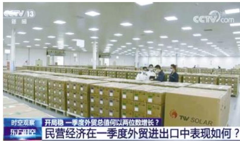
央视综合频道《东方时空》聚焦通威太阳能外贸出口

在央视《新闻联播》《东方时空》两大栏目以“民营经济在对外贸易中表现如何”的专题报道中,通威太阳能作为民营企业外贸出口表现优异企业获得聚焦。报道指出,“近日一批价值近千万元的光伏电池经中欧班列运抵法国,这是通威太