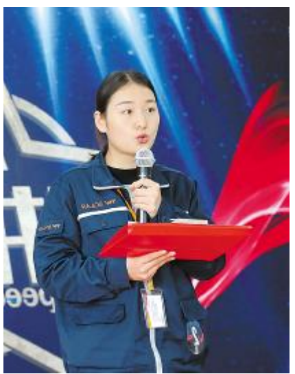
成都公司参赛选手精彩瞬间