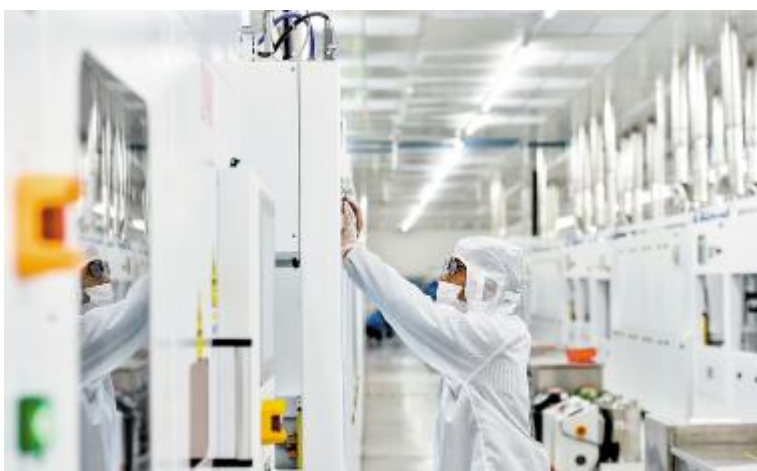
成都基地工程师正在进行设备调试

电池片的下线意味着第一条生产线已经正式进入试运行阶段,设备部也在根据实际生产情况,对每一个工序的相关参数进行优化。与此同时,第二条生产线的设备安装与调试工作也进入了最后的阶段,很快将进入试生产阶段。“第一条生产线的调试相对而言是最难的,所以耗时会比较久,但是第一条生产线也为我们其他生产线的开启积累了最重要的经验。我们整个部门有104位同事,大家都为接下来其余生产线的顺利开启做好了准备,也充满了信心。”