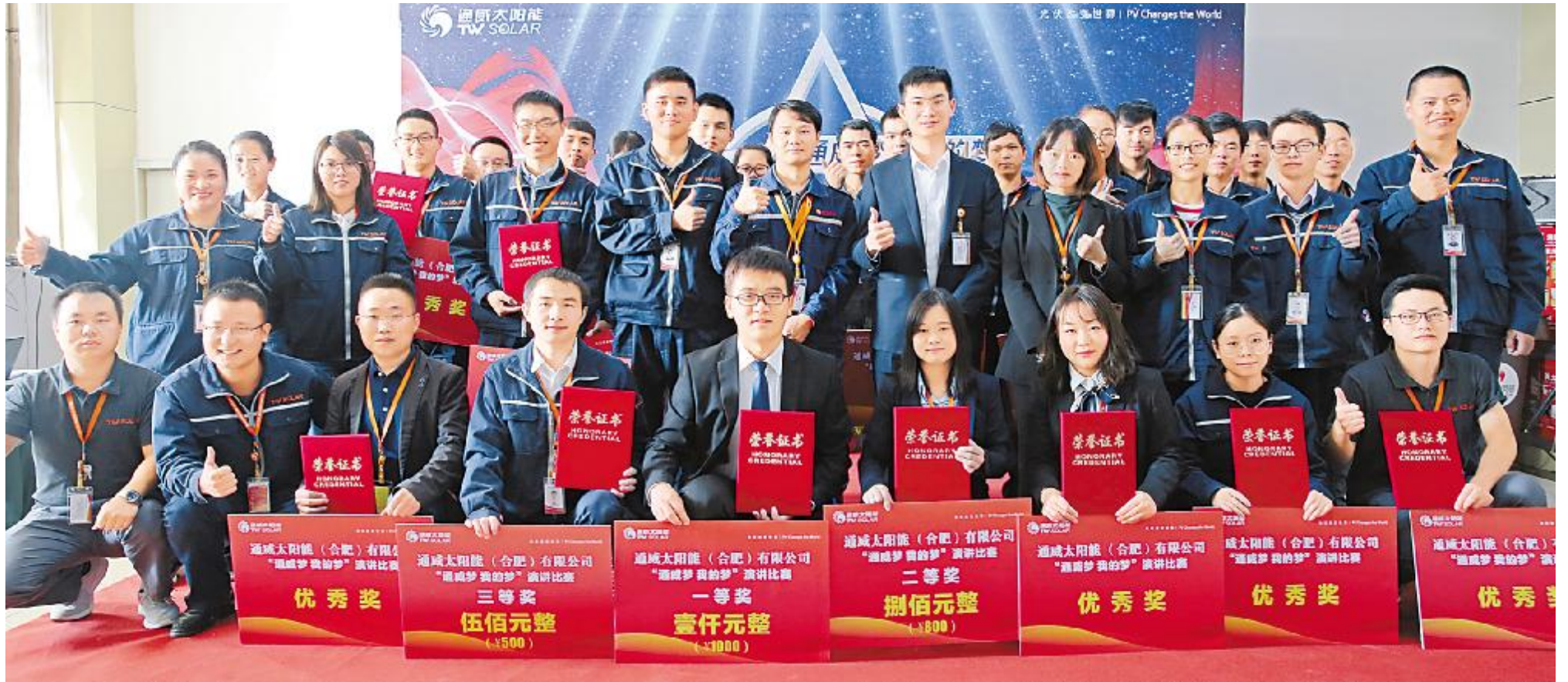
合肥公司全体参赛选手合影留念

通威太阳能始终秉持通威优秀的文化理念,并通过丰富多彩的企业文化活动,向员工传递通威精神。9月以来,为进一步激发员工们相互交流学习的积极性,加深员工对企业文化的理解,增强员工对公司的认可度和归属感,通威太阳能启动了“创建学习型团队”的读书成果分享活动和演讲比赛。第二、三期成果分享活动为电影《狼图腾》和《摔跤吧,爸爸》的观影分享,我们选取了其中部分作品进行刊登,以资读者。