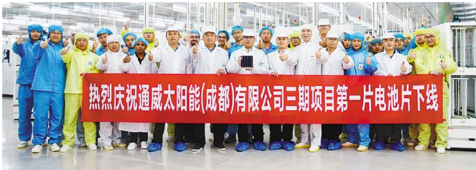
通威太阳能成都三期项目第一片电池片顺利下线合影留念

本报讯(通讯员 邱静媛)10月22日,通威太阳能成都三期高效晶硅电池项目A1车间内洋溢着紧张而期待的氛围,伴随着一阵热烈的掌声,通威太阳能成都三期第一片“智能制造”电池片顺利下线,电池片转换效率达到22.05%,隆重献礼通威太阳能五年华诞。