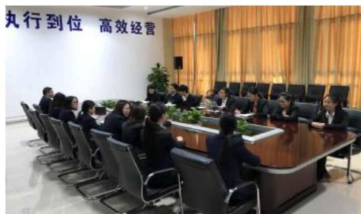
合肥公司财务部《没有任何借口》读书分享会现场