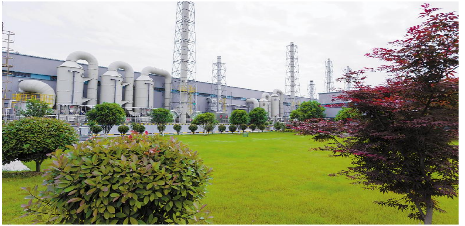
生机勃勃的通威太阳能合肥工厂

此次入选绿色工厂公示名单充分说明了通威太阳能的产品从原材料、生产制造到整个产品生命周期都是绿色清洁、低碳环保的。未来,通威太阳能也将继续秉承光伏改变世界的初心,积极建设绿色制造体系,推动节能减排,低碳发展,为早日实现蓝天白云、青山绿水而不懈奋斗。