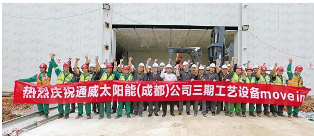
成都基地三期工艺设备进厂

本次评定的顺利通过,是国家工信部对通威太阳能信息化和工业化深度融合的充分认可,同时为企业有效推动和持续改进两化融合提供了发展框架、管理方法和手段,避免走信息化弯路,加快提升了企业内部管理效能,保证企业战略的有效落地。