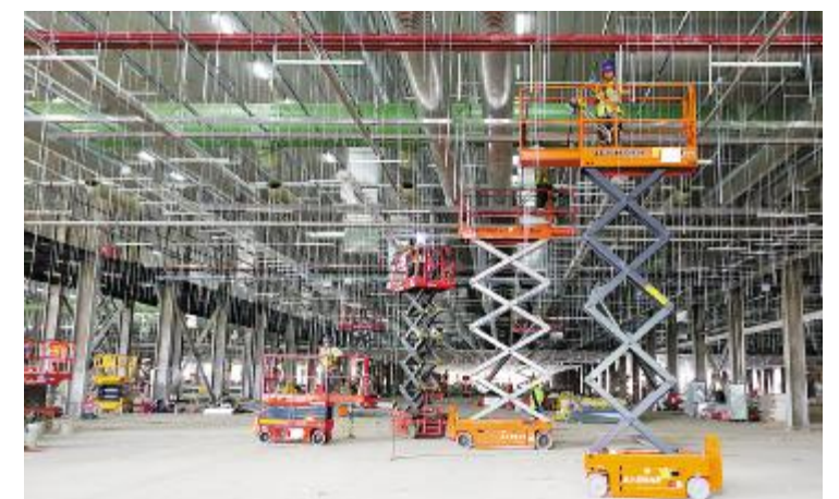
合肥基地新项目建设如火如荼

据了解,后期,通威大学光伏学院将持续关注新项目人才培养和发展需求,并充分利用线上线下资源为员工赋能,为新项目的高速运转添砖加瓦。