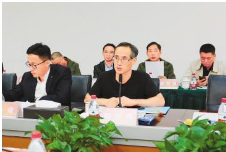
合肥基地校企对接会现场