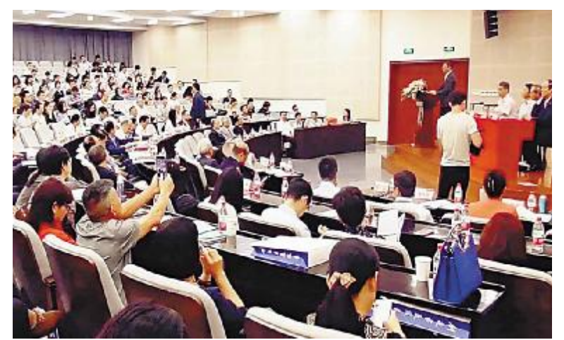
第三届亚洲质量功能展开与创新研讨会现场

在27日举行的质量功能展开(QFD)、创新亚洲质量功能展开(QFD)项目发表赛中,经过激烈角逐,通威太阳能凭借创新项目“QFD在高效晶硅太阳能电池片设计上的运用”荣获亚洲质量创新优秀项目一等奖,亚洲质量功能展开协会会长新藤久和教授为获奖项目颁奖。