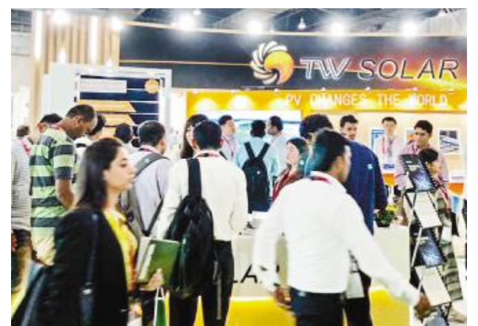
印度新德里展会现场通威太阳能展台受关注