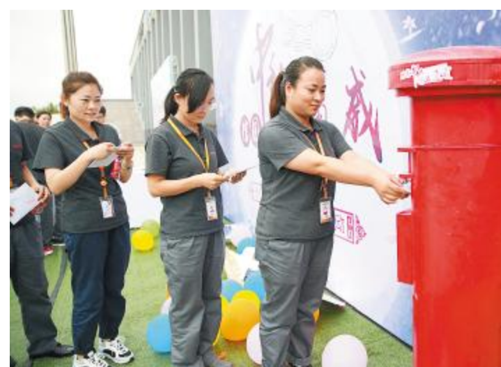
员工们投递出一封封祝福的书信