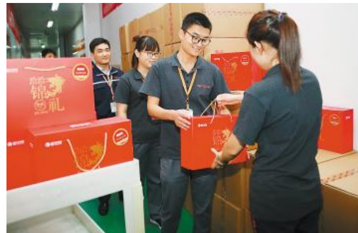
喜气洋洋的中秋大礼包满载祝福