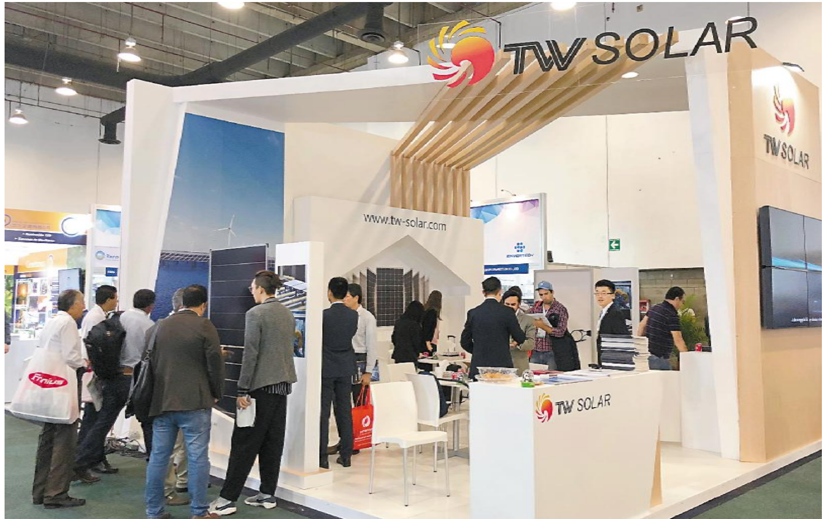
通威太阳能首次亮相墨西哥国际绿色能源展