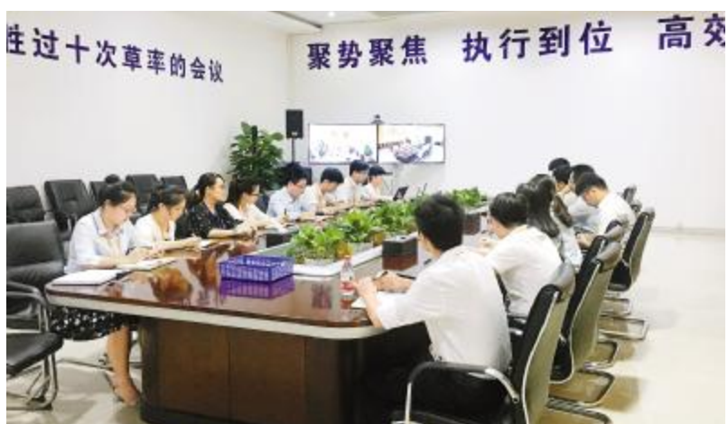
合肥基地员工正在讨论《用认真概括自己》读后感

今年,公司将重点围绕两地新项目建设,优化企业文化硬环境。根据两地新项目接待需求和实际情况,落实展厅的设计装修工作。另外,还将根据成都基地新办公楼、行政区等新建项目,配套设计优化室内、户外VI系统,提升文化、工作环境,并结合新版VI设计及现阶段可视化落地成果,梳理总结并编入新版《通威太阳能企业文化VI落地手册》中,持续为各部门及员工搭建全面的企业文化理解平台,进一步规范VI的落地实施,将公司的VI管理持续、有效、精细化推进。