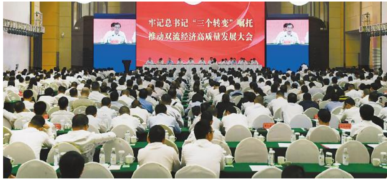
通威太阳能受邀出席双流经济高质量发展大会