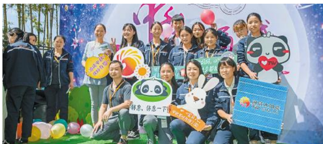
员工们在活动现场合影留念