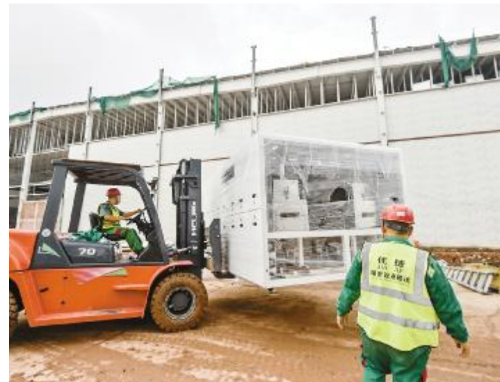
成都基地三期项目大型设备正在进场

为确保节假日期间安全生产形势持续稳定,严防安全生产事故的发生。合肥、成都两地在节日前夕同步进行了节前安全检查。检查组由高管带队,分别深入各车间、仓库、生活区及在建项目工地等区域进行生产设施设备安全、危化品安全、电气安全、施工安全及环境安全等各类隐患排查。检查中,检查组现场对不符合安全生产要求的地方提出了整改意见,责令整改,不留安全死角,全力保障节日期间的安全生产工作。