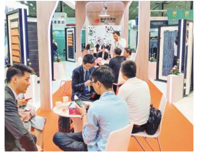
台湾展会现场通威太阳能展台众多客户交流

以参展为契机,通威太阳能参展团队在接待好来访嘉宾的同时,也积极走出去,前往行业优秀企业展台参观学习,看行业的市场变化,了解新的市场需求以及新的技术,加强合作交流,并再次展示了引领行业的发展实力。