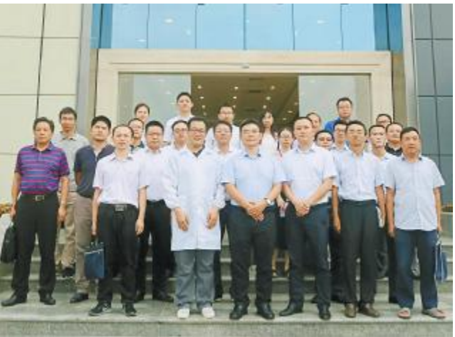
成都市委全面深化改革领导小组调研通威太阳能

在合肥市大建设大跨越大发展的时代背景下,在市委、市政府的坚强领导下,通威太阳能也将积极开拓创新,加快企业转型升级步伐,坚定“诚、信、正、一”的经营理念,为建设“大湖名城、创新高地”贡献力量。