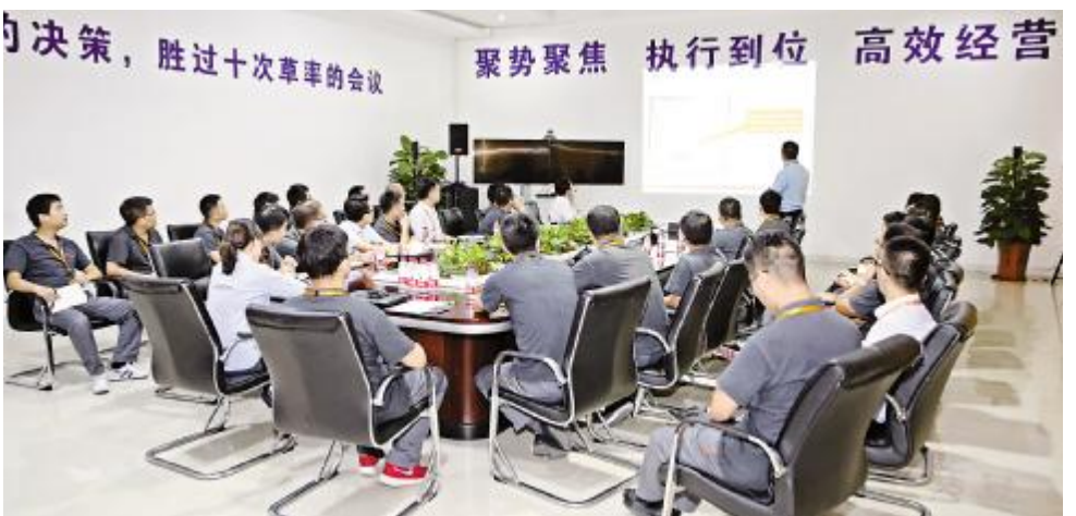
优秀管理案例分享活动现场

本次活动旨在强化管理者在工作过程中主动发现问题、主动思考解决问题的意识。谢总表示,依照当前的行业形势与发展状况,公司对业务团队提出了更高的要求,各业务部门要牢牢把握优秀管理案例的分享内容,通过每月一次的案例分享不断总结经验教训,持续积累优秀管理素材。