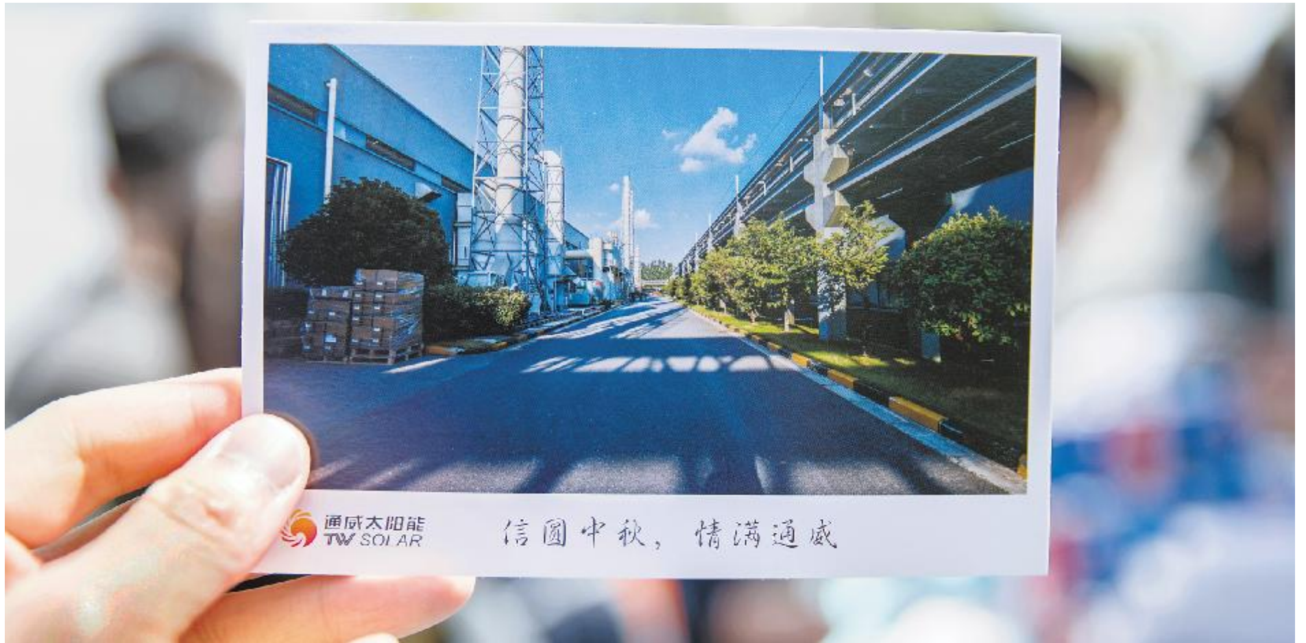
精美的明信片融合了厂区与中秋元素的巧思