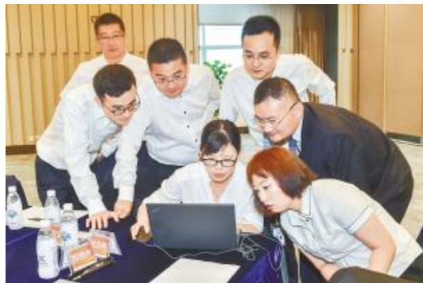
会议现场大家热烈讨论