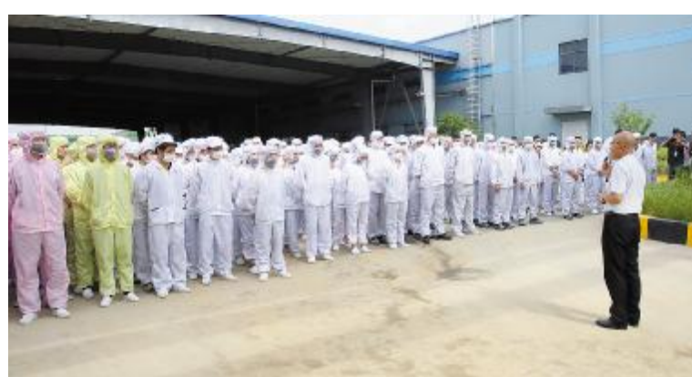
合肥公司应急疏散演练活动现场

本届“安全生产月”活动系通威太阳第五届安全生产月主题活动,吸引了两地共计千余名员工参与。活动虽已结束,安全生产仍在继续。未来,安全生产月活动将逐步向全员参与迈进,安全生产更将进一步渗透到工作的点点滴滴。本次活动的成功开展积极推动了公司2018年安全生产各项工作的深入、有效进行,进一步引导了公司员工学习安全知识,强化企业安全文化教育,大力营造企业安全文化氛围,全面保障公司安全高效生产。