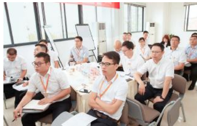
管理经验分享会现场